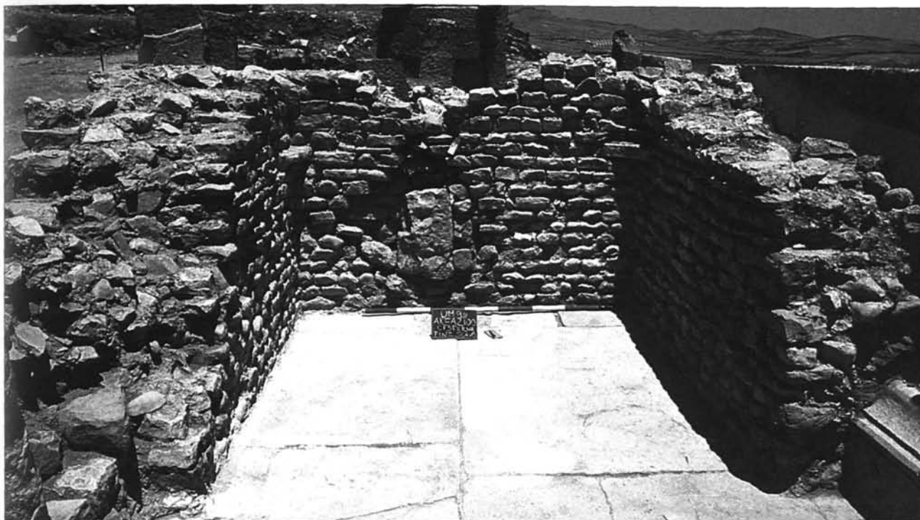
Fig. C. 2. Vchi Maius , foro: cisterna addossata alla base della statua equestre di Settimio Severo.

logia, per sapere in quali tipi di edifici si inserissero e per tentare di comprenderne il rapporto con le omologhe strutture presenti nelle campagne.