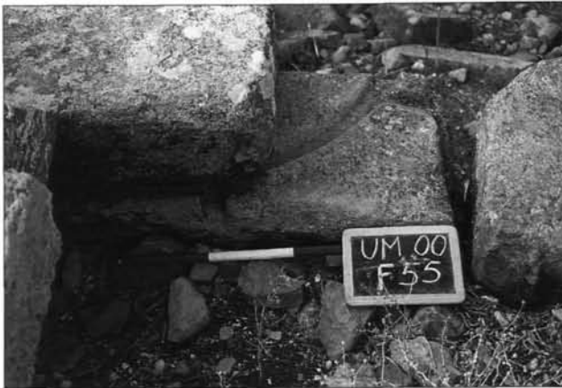
Fig. C. 4. Vchi Maius , porzione di base di pressa reimpiegata nella fortificazione.