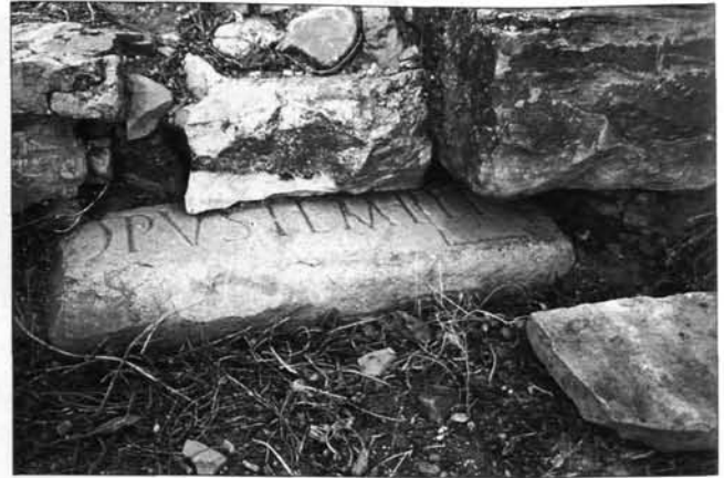
Fig. C. 5. Vchi Maius , porzione di iscrizione reimpiegata nella fortificazione.