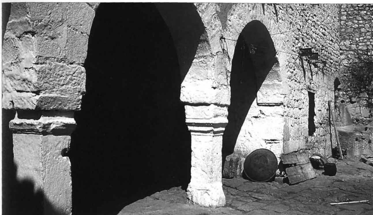
Fig. C. 3. Pagus Suttuensis , cortile.

una base di pressa 60 . Nell'Area 24.000 sono stati riutilizzati parte di un contrappeso in una delle scale e un blocco con intaglio a croce nel muro US 24.071 61 . Tra gli elementi lapidei reimpiegati in frantoi che sono stati recensiti nell'area urbana 62 si segnalano: un'altra base di statua (F. 29) 63 , blocchi modanati, uno adattato a contrappeso (F. 6), altri due (F. 31 e F. 57) - o forse tre (F. 46) - recanti l'incavo a coda di rondine. Alcuni bacini in calcare bianco rinvenuti sul sito sono stati ricavati da blocchi modanati (F. 59) o decorati con rilievi a motivi vegetali (F. 16, F. 58): non possiamo attribuirli con certezza a frantoi, anche se la vicinanza con elementi sicuramente ad essi riconducibili lo farebbe pensare. Le basi modanate riutilizzate come contrappesi presentano una particolare rilavorazione: il solco che collega sulla fronte i due incavi a coda di rondine realizzati sulle facce quadrangolari non interessa tutta la superficie, bensì solo le cornici e le parti aggettanti e sulla base della statua dedicata a Lucilla è di forma trapezoidale 64 .