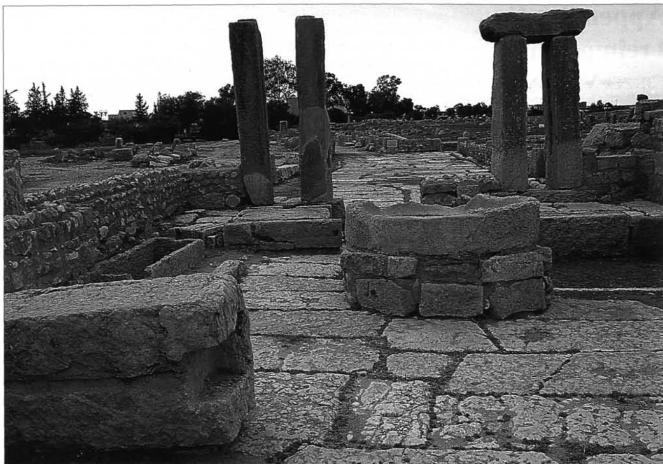
Fig. C. 1. Sbeitla, frantoio bizantino.

Maurin su Thuburbo Maius 12 , alle ricerche sulle testimonianze relative a Cherchel 13 , Sétif 14 , Thugga 15 , Bulla Regia 16 , Lepcis Magna 17 in età tardo- e post antica. Sulla base dei risultati di queste ricerche sono nati i primi lavori di sintesi sui mutamenti delle città africane dall'età imperiale alle invasioni arabe 18 che, anche se passibili di sviluppi e affinamenti, pongono in evidenza una serie di problemi e rappresentano un'ottima base di discussione.