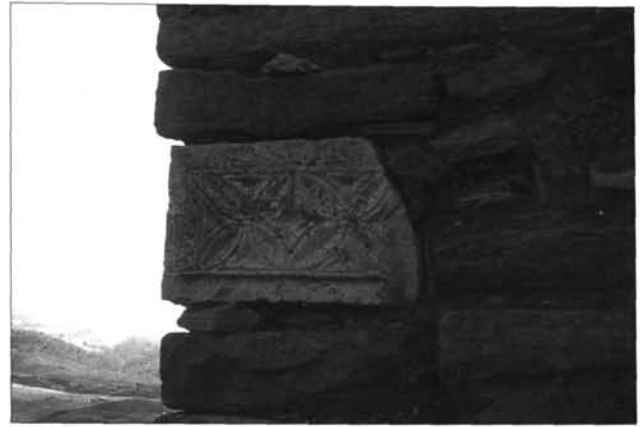
Fig. C. 8. Vchi Maius , blocco angolare a rilievo reimpiegato nella kubba .

più ampia di quella della canaletta e, trapassata al centro da un foro, funse da porta ruotante entro una sorta di binario, anch'esso ottenuto riutilizzando elementi di una canalizzazione che vennero in parte rilavorati 71 , costituendo un dispositivo simile a quello attestato in tombe a camera dell'area palestinese 72 e ampiamente diffuso in Cappadocia nelle "underground cities" 73 . Vanno infine ricordati gli elementi lapidei lavorati reimpiegati nella kubba : i fusti di colonne (fig. C. 7) e alcuni dei blocchi del paramento, tra i quali riveste particolare interesse uno angolare, nato come cuneo di un arco, con la raffigurazione di un carro a rilievo, successivamente lavorato sul lato adiacente con elementi a rosetta (fig. C. 8), con ogni probabilità per essere posto in opera nella basilica cristiana poco distante 74 .