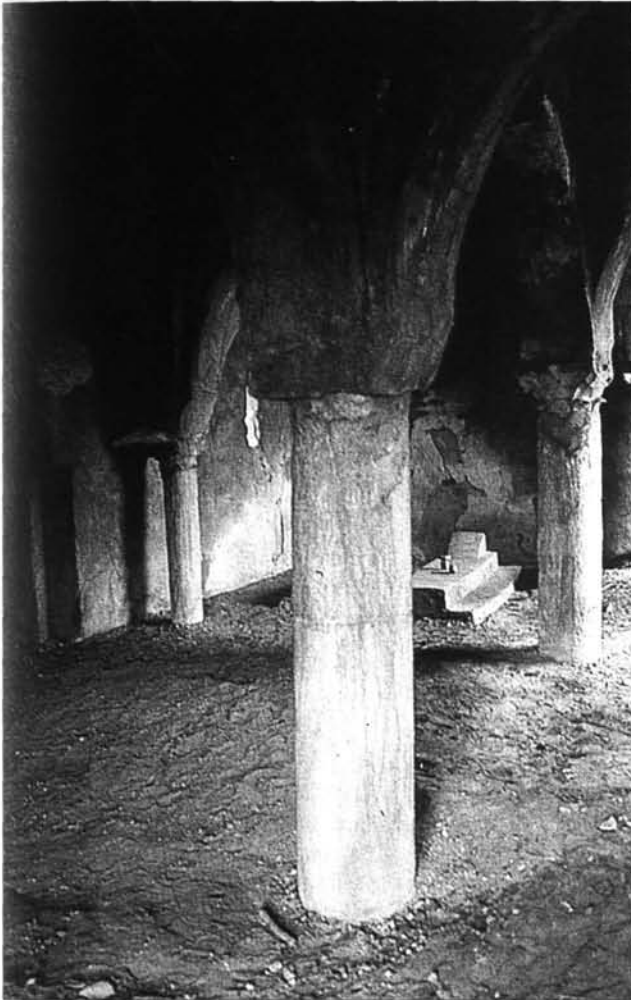
Fig. C. 7. Vchi Maius , fusti di colonne reimpiegati nella kubba .