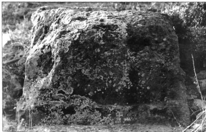
Fig. 2 - L'altare di Iuppiter : lato SE con la scritta dei (?)