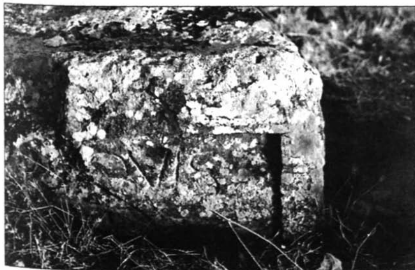
Fig. 3 - L'altare di Iuppiter : lato NO con la scritta Iovis .