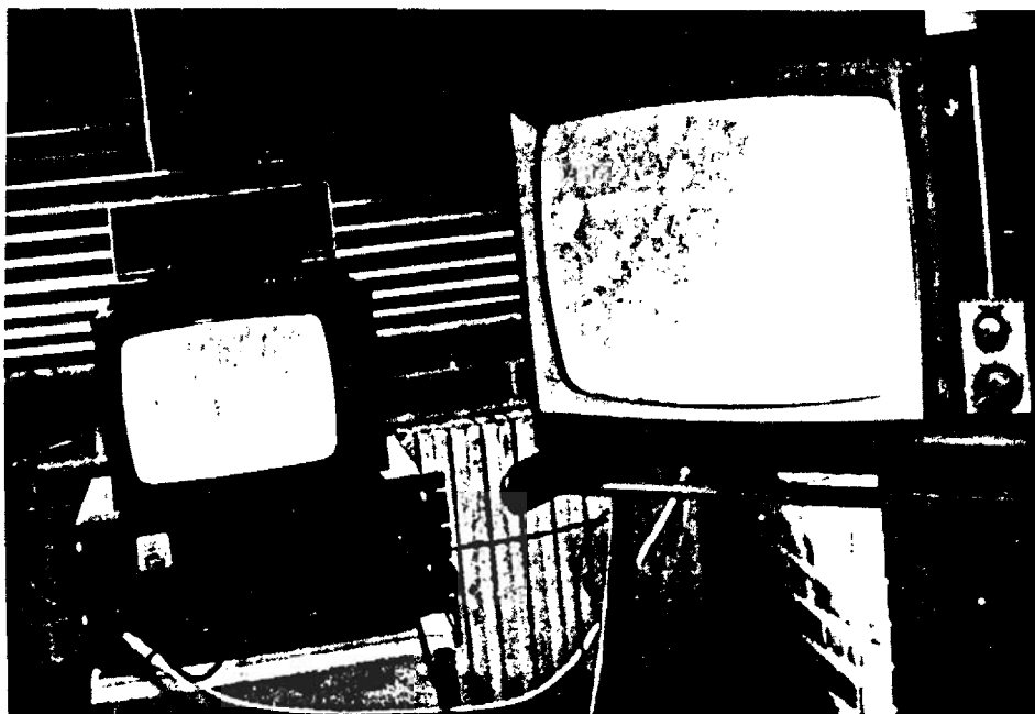
Fig. 2 - Apparatì di ricezione immagini Meteosat. System for receiving Meteosat images.

(controllo automatico di frequenza), converte il segnale in arrivo dal satellite sulla frequenza 134-137 MHz.