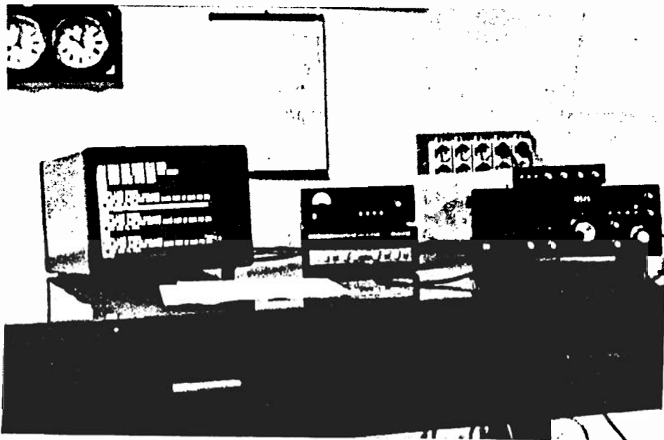
Fig. 1 - Apparatii di telecomunicazione. Telecommunication system.