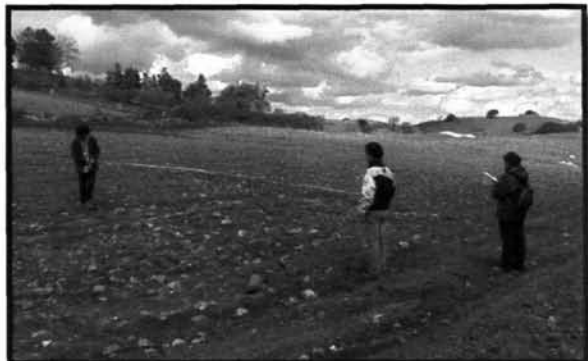
Fig. 2 - Una fase della ricognizione del villaggio abbandonato di Orria Pithinna.