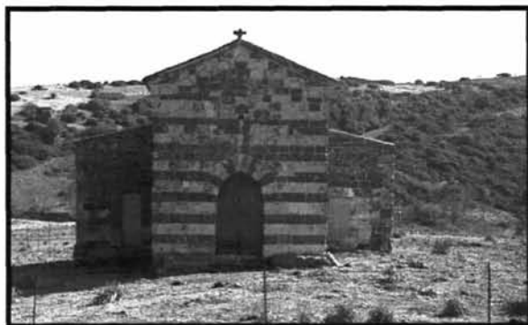
Fig. 1 - La chiesa medievale di Santa Maria Maddalena di Orria Pithinna.

La ricerca tuttora in corso ha evidenziato un cospicuo numero di indicatori archeologici, storici e toponomastici riferibili agli insediamenti medievali abbandonati di Orria Pithinna , San Giuliano , Bidda Noa , Badu Olta , Paules ed Erva Nana , la cui consistenza materiale è in corso di verifica. Particolare interesse riveste inoltre la cronologia degli spopolamenti, forse da mettere in relazione con la fon-