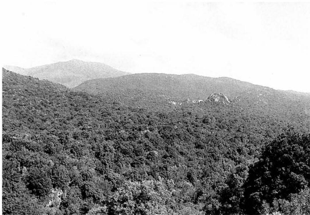
La foresta che ricopre le colline del Sulcis

la lontananza dei luoghi, talvolta addirittura inaccessibili, sia in rapporto alla mancanza di strade. «Costano meno le legna forestiere, benché stranamente care – sosteneva il gesuita piemontese – che quelle del regno per il dispendio e per la difficoltà dei trasporti.»