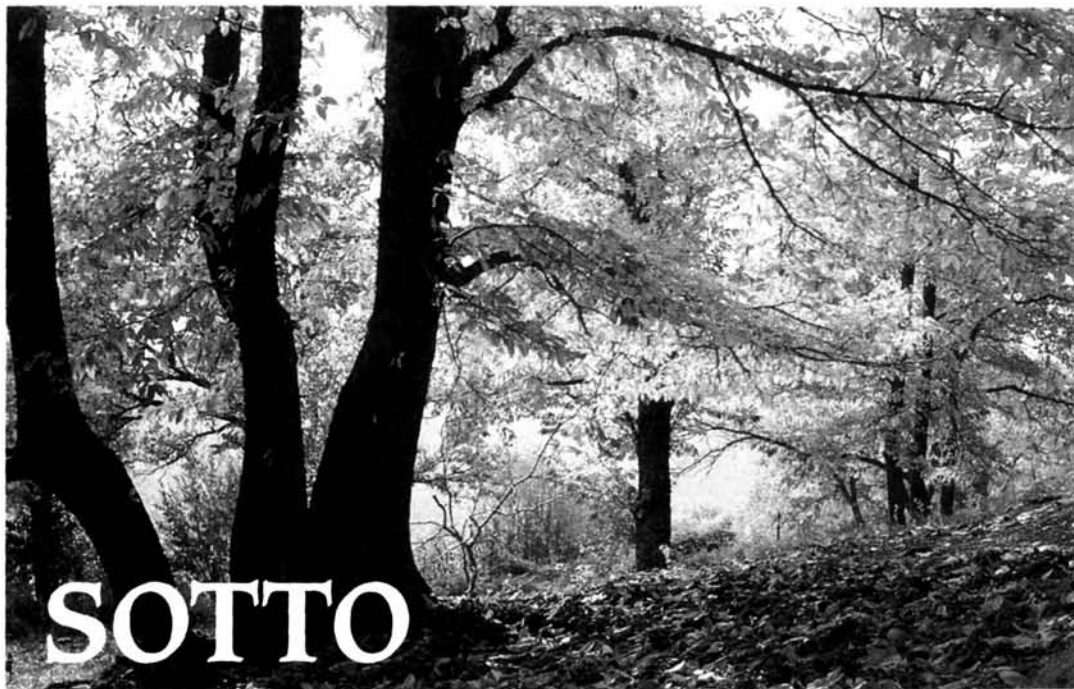
Bosco di castagni in Barbagia