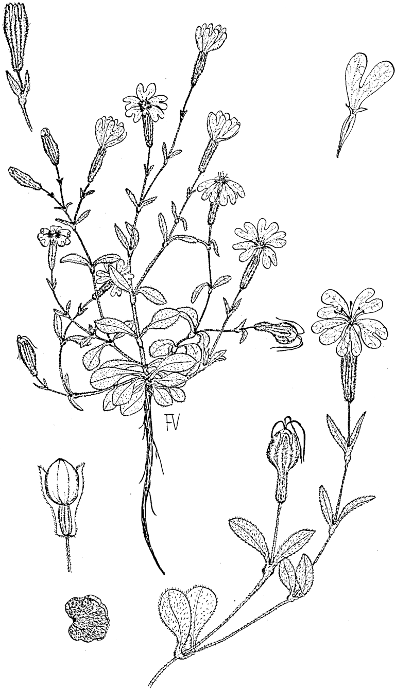
Fig. 1 - Silene morisiana Bég. et Rav.: pianta intera \times 0,5 ; ramo, petalo, calice e capsula \times 1 ; achenio \times 5 .