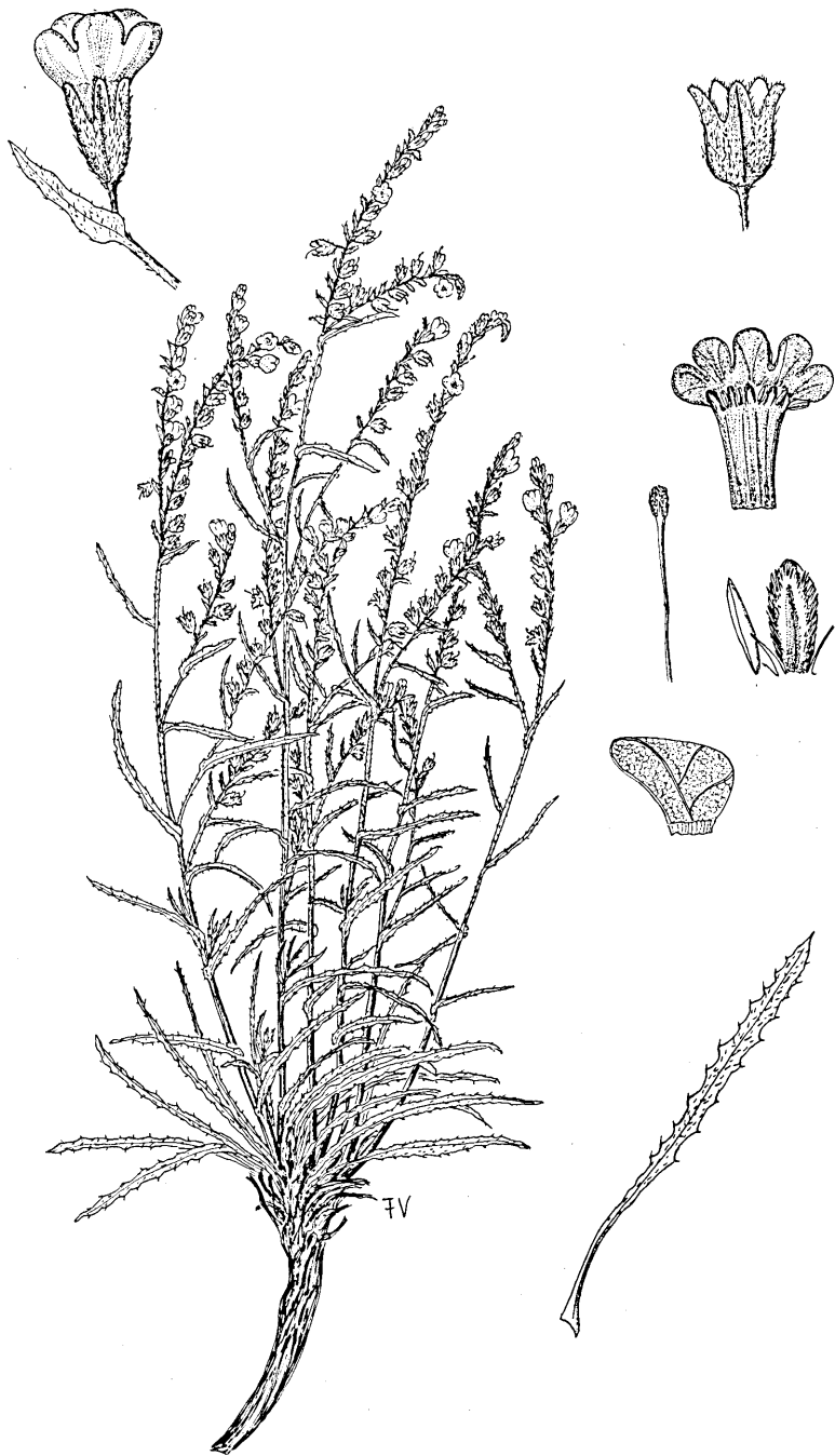
Fig. 1 - Anchusa maritima Valsecchi: pianta intera \times 3,5 ; fiore, calice fruttifero, corolla aperta \times 2 ; squama con antera e stilo \times 10 ; achenio \times 7 ; foglia \times 0,5 .