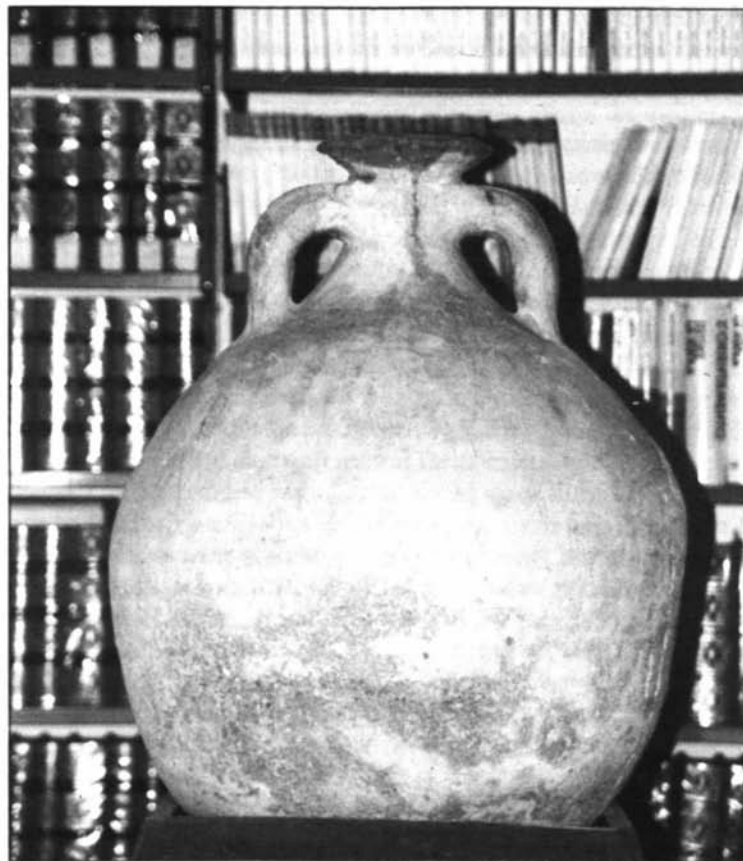
16 - Anfora olearia Dressel 20, II secolo d.C., di provenienza iberica, rinvenuta a Bosa in località Messerchimbe. (Bosa (NU), Biblioteca Comunale)

Settimio Severo l'olio dell'Africa divenne essenziale per Roma, l'Italia e per molte province. Accanto alle anfore vennero stivate nelle navi in partenza dai porti della Proconsolare le ceramiche in sigillata chiara "A" prodotte nei sobborghi di Cartagine. Tra gli ultimi decenni del II secolo e la metà del III secolo verificiamo una nuova produzione ceramica: quella in sigillata chiara "C", di cui erano responsabili le botteghe della Byzacena. A Neapolis, Hadrumetum, Leptis Minor e Sullectum si producevano le anfore «africane piccole» e, successivamente le «africane grandi» destinate essenzialmente al trasporto dell'olio. Tra la fine del III secolo d.C. e gli inizi del IV rinacquero le fabbriche di ceramica della Tunisia settentrionale dove la sigillata chiara D è sicuramente erede della sigillata chiara A. Nelle stesse botteghe si ebbero larghe produzioni di lucerne dette «mediterranee» o «africane» destinate anch'esse sia al mercato interno, sia all'esportazione,