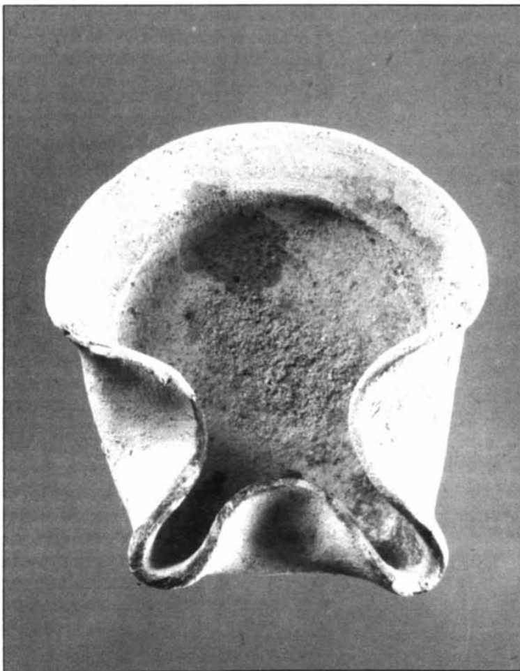
13 - Lucerna costituita da un piattino con i bordi ripiegati per trattenere il combustibile, età punica. (Sassari, Museo Archeologico Nazionale "G.A. Sanna")