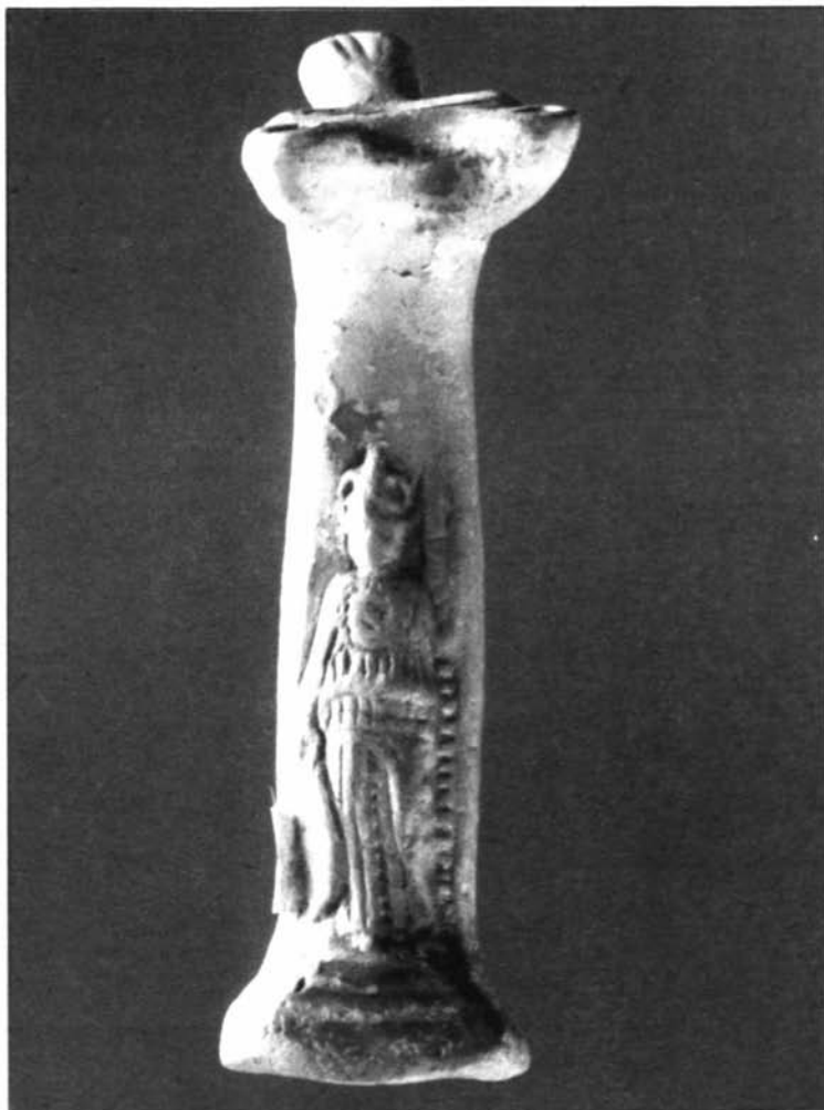
15 - Lucerna su sostegno figurato, di età romana imperiale. (Sassari, Museo Archeologico Nazionale "G.A. Sanna")

grano continuò per tutto l'impero ad essere la risorsa principale della Sardegna, che ancora nel IV secolo nell' Expositio totius mundi et gentium appare come ditissima fructibus et iumentis et est valde splendidissima 35 .