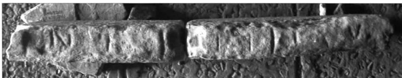
Fig. 4. 45. Le lastre cat. nn. 6 e 7 in opera.