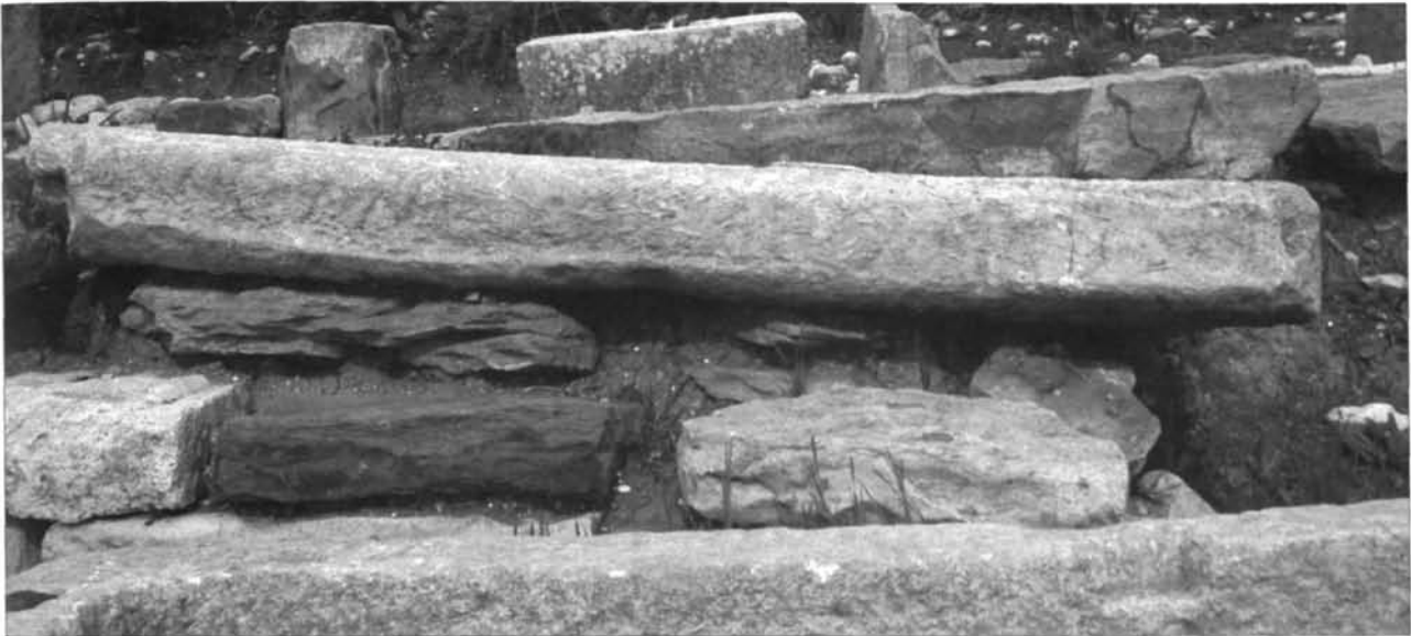
Fig. 4. 40. La lastra cat. n° 4.

del quale sussistono due esigue porzioni presso gli spigoli. I singoli gruppi di lettere, come si è detto, sono separati da profonde scanalature verticali, che dividono il campo epigrafico in settori di identica lunghezza. Altre scanalature precedono e seguono i fori di alloggiamento delle grappe.