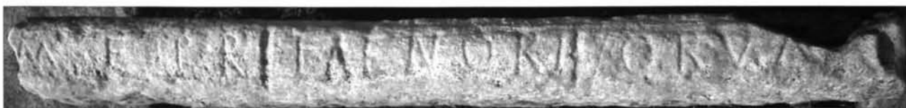
Fig. 4. 42. La lastra cat. n° 5.

la frattura all'estremità della lastra. Il manufatto venne messo in opera lasciando a vista la faccia inferiore, sbazzata grossolanamente con la subbia; il piano su cui venne incisa l'iscrizione non sembra sia stato ribassato 93 .