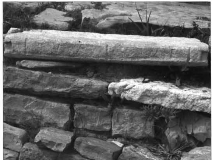
Fig. 4. 39. La lastra cat. n° 3.