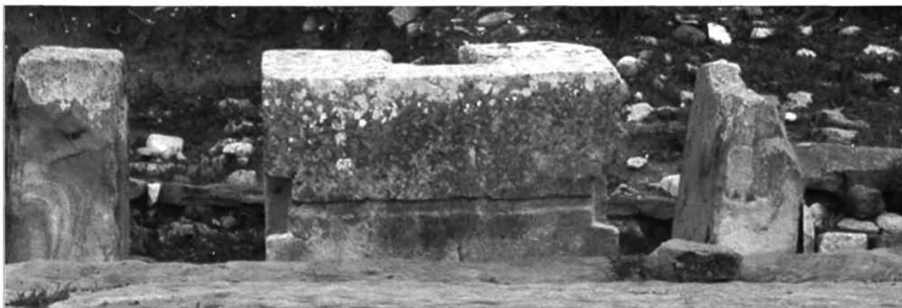
Fig. 4.36. I solchi e gli incavi praticati nella base a Karthago (cat. n° 1) in occasione dei riusi come contrappeso e come incastro per la testa del prelum .

laurea sulle iscrizioni di Vchi Maius 83 .