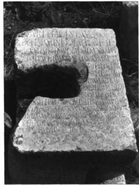
Fig. 4. 37. La base a Karthago , cat. n° 1.

Bibl.: MERLIN 1907, 94-95; MERLIN, POINSSOT 1908, 24-26 n° 3; AE , 1908, 91; CIL , VIII, 26239; ILS 9398; DUNCAN-JONES 1962, 87 n° 157, 96 n° 279, 111 n° 144; DUNCAN, JONES 1963, 175 nn. 157, 279; DUNCAN-JONES 1982 2 , 97 n° 157, 104 n° 279; BENZINA BEN ABDALLAH 1988, 37 n° 8; LADJIMI SEBAI 1988, p. 64 nn. 32-33; WESCH-KLEIN 1990, 251 n° 6, 398; RUGGERI, ZUCCA 1994, 662 n° 113, 666-667; KHANOUSI 1997, 186-187; UGHI 1997, 213, 231-232 n° 9; VISMARA 1999, 76. Da ultimo, Vchi Maius 2, 2006, n° 5 [E. Ughi].