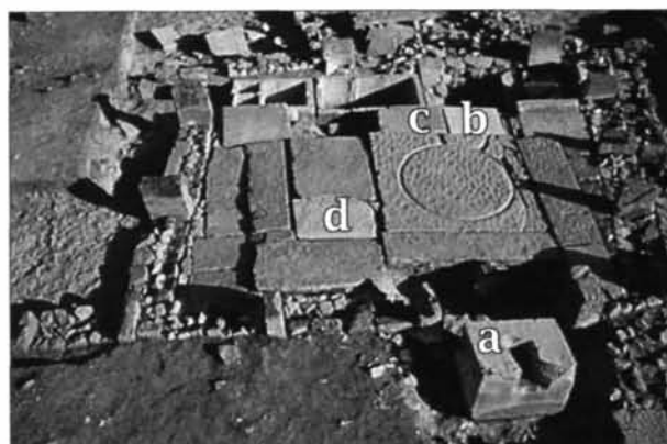
Fig. 4.35. La posizione delle lastre cat. n° 1 (a), n° 3 (b), n° 4 (c), n° 5 (d) nella pavimentazione del vano A.

Blocco parallelepipedo in calcare grigiastro, privo di modanature, scoperto dal capitano Gondouin a circa 200 m a sud-est del basamento della statua equestre di Settimio Severo 82 . La base fu rilevata nel 1993 nel corso della ricognizione effettuata per la redazione di una tesi di