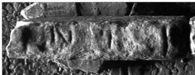
Fig. 4. 43. La lastra cat. n° 6.

piazza dei prestiti a usura, o delle banche), come non è chiaro il termine che lo precede e che, nonostante sia fortemente lacunoso, è sicuramente abbreviato. Si potrebbe altrimenti pensare ad un errore nell'incisione di faenarii 96 , i mercanti di fieno, che però sarebbe stato al genitivo: faenariorum forum , la piazza dei mercanti di fieno.