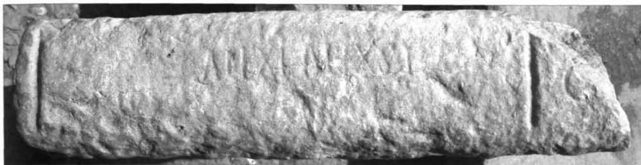
Fig. 4. 46. L'iscrizione Vchi Maius 2, n° 100, 4.

Le lastre n° 6 (fig. 4. 43) 97 e n° 7 (fig. 4. 44) 98 , provenienti forse dal vano C 99 , si trovano attualmente nel magazzino e dall'esame autoptico sembrerebbero combacianti (fig. 4. 45).