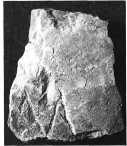
Fig. 4. 38. La stele frammentaria cat. n° 2.

Le iscrizioni delle due lastre sono state incise dopo aver ribassato il piano bombato originario,