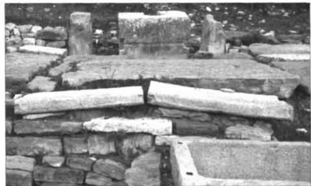
Fig. 4. 41. Le lastre cat. nn. 3 e 4 in opera.

La lastra quadrangolare n° 5 (US 22.044, fig. 4. 42) 92 è inserita anch'essa nel lastricato del vano A, a diretto contatto con l'angolo N della base di pressa e presenta una lacuna nell'angolo occidentale (fig. 4. 35). Alle estremità del lato anteriore (spessore) sono gli incavi "a coda di rondine" per l'assemblaggio con le lastre giustapposte; quello di sinistra è parzialmente visibile a causa del-