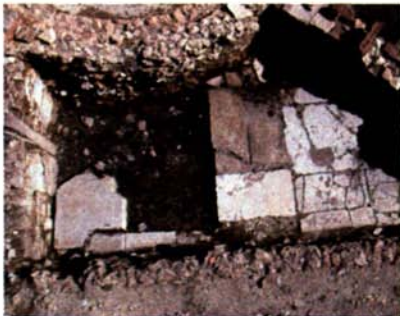
Fig. 6: La pièce de dépôt à la fin de la campagne de fouille de 2002