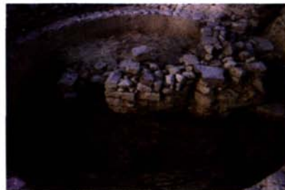
Fig. 3: Le bassin circulaire avec la mosaïque polychrome (datable du début du IV e siècle d'après le schéma centralisé avec trois éléments en forme de haricots intersectés) à la fin de la campagne de fouilles de 2001 et à la fin de la campagne de fouilles de 2002

Fig. 3: La vasca circolare con il mosaico policromo (databile all'inizio del IV secolo sulla base dello schema centralizzato con tre elementi a forma di fagiolo che si intersecano) alla fine della campagna di scavo del 2001 e alla fine della campagna di scavo del 2002