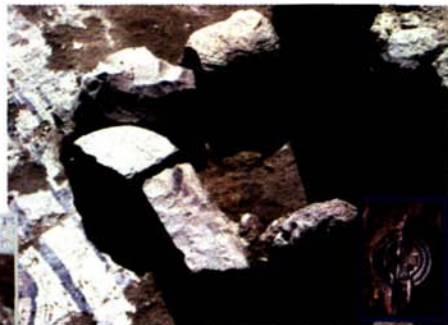
Fig. 8: Il focolare impostato direttamente sul piano mosaicato e la lucerna con croce gemmata (forma Hayes II B, databile tra la seconda metà del V e il VII secolo) ivi rinvenuta in condizioni frammentarie, ricomposta quasi integralmente