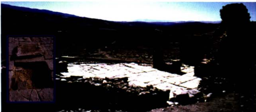
Fig. 4: Il triconco alla fine della campagna di scavo 2002 e un sondaggio sotto il piano di lastroni dove sono stati individuati frammenti di una precedente pavimentazione musiva