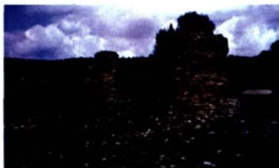
Fig. 2: Il complesso termale prima dell'intervento di scavo