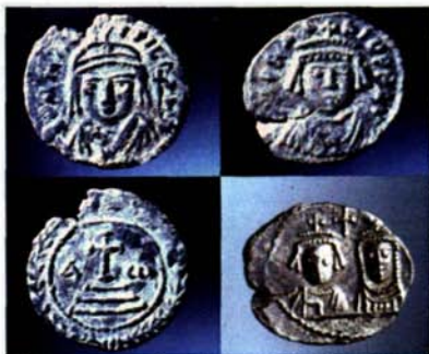
Fig. 5: Lato sinistro: moneta in argento di Maurizio Tiberio (602 d.C.); lato destro: moneta in argento di Eraclio (617-641 d.C.)

cours d'étude): d'après les trouvailles numismatiques, on peut le dater de la première moitié du VII e siècle (Fig.5). Un sol en grandes dalles, en phase avec la pièce trilobée, est apparu au-dessous des couches de dépôt (Fig.6). L'enlèvement de la couche d'humus superficiel (commencé en 2002 et continué en 2004) a d'ailleurs mis en évidence le périmètre d'une grande pièce rec-