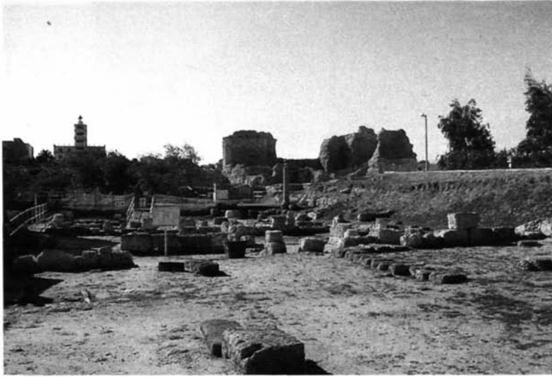
Fig. 8 – Portotorres, le Terme romane del Palazzo di re Barbaro (visitato dal Mommsen il 25 ottobre 1877).