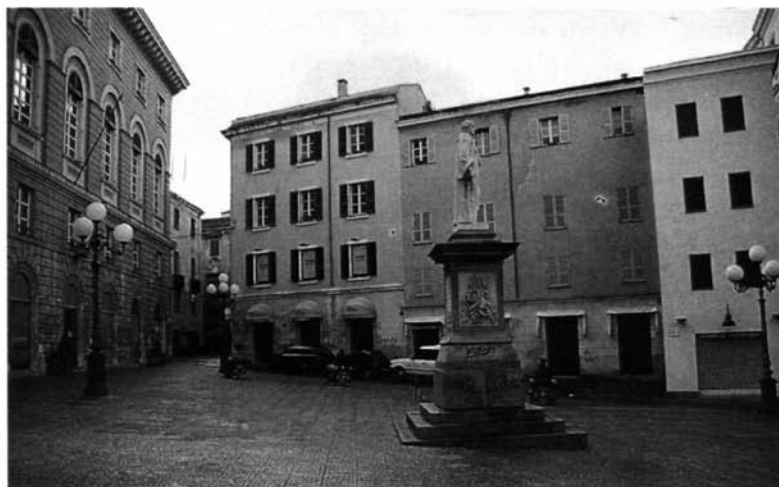
Fig. 7 – Sassari, Hotel Italia (il Mommsen vi si trattenne dal 23 al 27 ottobre 1877).

e più tardi sarebbe nato il Regio Museo di antichità, istituito da Umberto I con Regio decreto del 26 maggio 1878 (163) , finanziato con i fondi della Provincia e del Comune per l'Università ed inaugurato da Ettore Pais il 20 novembre 1880 nel contiguo palazzo di via Porta Nuova (Fig. 10) (164) . Certamente non vi fu invece una visita