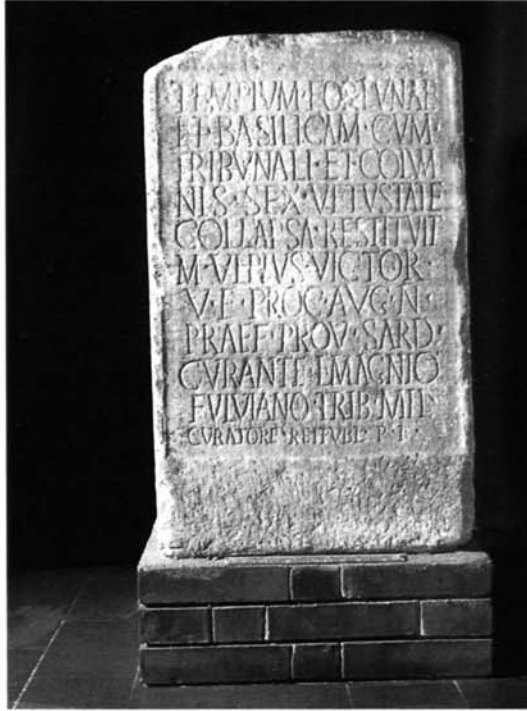
Fig. 2 – La base che ricorda a Turrus Libisonis il restauro del tempio della Fortuna (CIL X 7946).

l'iscrizione relativa al tempio della Fortuna di Torres non fu dissotterrata nel 1820 [Fig. 2]; essa è al suo luogo sulle rovine del monumento, e perciò nulla vieta, che già anticamente fosse vista e trascritta o dal Gili o da altri prima di lui. Io credo quelle iscrizioni invenzione di un pio ed ignorante Sassarese del secolo XIV; il loro tenore ed argomento non rassomiglia in nulla a quello delle sincere carte Arboresi; ché, come già notai, quel codice non è per nulla arborese» (105) .