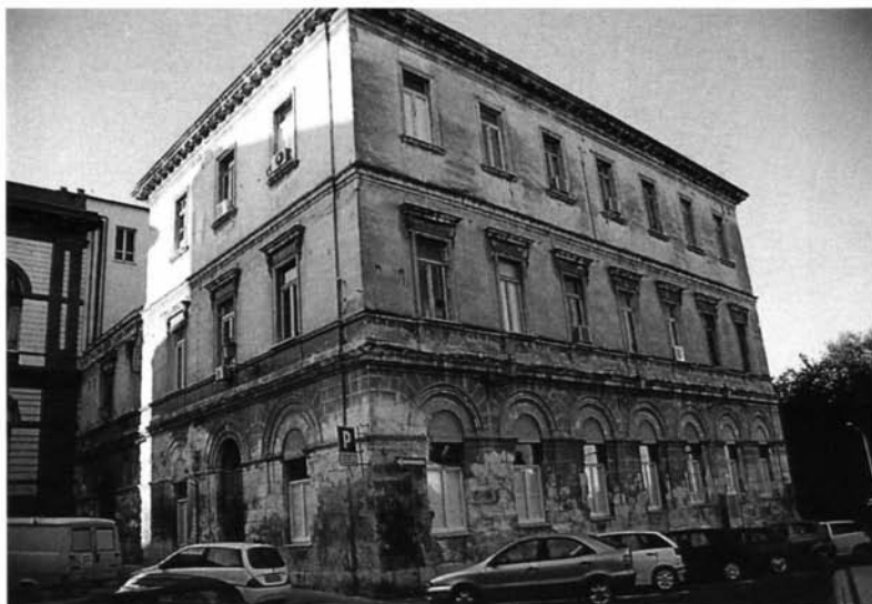
Fig. 10 – Sassari, il Palazzo di Via Porta Nuova, sede del Museo dell'Università dal 1880.

nel 1698 e ricordata apparentemente in una scheda di un Anonimus Hispanus (165) .