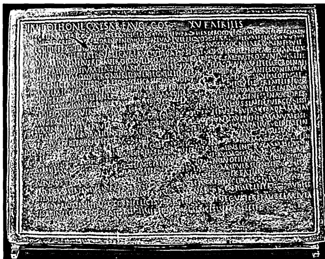
Fig. 1 – La Tavola di Esterzili (CIL X 7852).

Scrivendo da Cagliari il 18 maggio 1866, il Nissen riferiva di esser rientrato col battello da Tunisi in Sardegna e raccontava le difficoltà incontrate, perché lo Spano era partito, la biblioteca era chiusa per le vacanze, come pure l'Università; eppure la gente era molto premurosa e disponibile: come è noto lo Spano insegnava a Cagliari, dove a causa del clima e della malaria le lezioni terminavano con molto anticipo, il 1 maggio, in occasione della festa di S. Efsio e le vacanze arrivavano fino al 15 luglio; l'Università di Cagliari infatti «si distingueva fra tutte le altre per il tempo assegnato alle vacanze», con grande soddisfazione dello Spano, che in primavera era libero di dedicarsi alle sue «escursioni archeologiche e fisiologiche nel centro dell'isola» (41) . Nella stessa lettera il Nissen dava per la prima volta la notizia del ritrovamento della Tavola di Esterzili (Fig. 1), anticipato però dal Baudi Di Vesme, che aveva scritto in proposito allo Hänel già l'8 maggio (42) : «Vor Kurzem ist in Sardinien eine große Bronzetafel, enthaltend einen Schiedsspruch in Grenzstreitigkeiten zwischen 2 bis dato unbekanntten Völkerschaften, gefunden worden, jetzt im Besitz Spanos, dessen Rückkehr ich in einigen Tagen entgegen sehe» (43) .