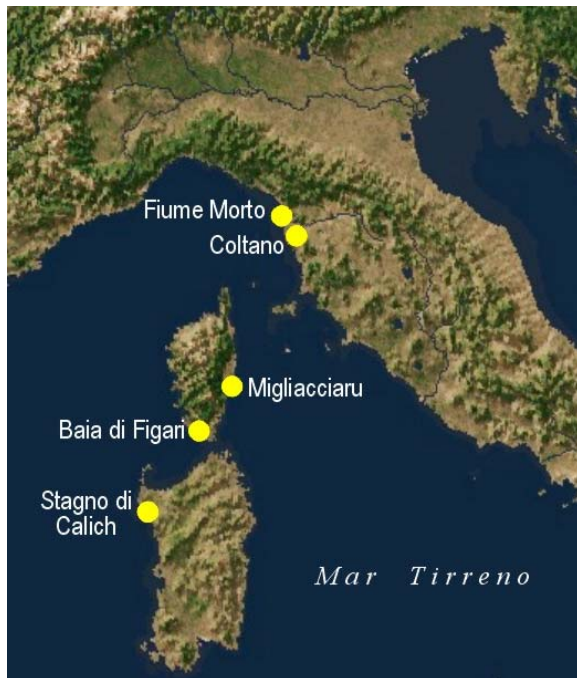
Fig. 2. Siti di campionamento.

I campioni di H. diversicolor utilizzati nel presente lavoro sono stati raccolti da cinque biotopi salmastri mediterranei nell'estate del 2002: 1) Fiume Morto (FMO, Toscana nord-occidentale: 43°44'N, 10°16'E), 2) Coltano (COL, Toscana nord-occidentale: 43°40'N, 10°22'E), 3) Migliacciaru (MIG, Corsica orientale: 42°0'N, 9°22'E), 4) Figari Bay (FIG, Corsica sud-occidentale: 41°29'N, 9°04'E), e 5) stagno di Calich (CAL, Sardegna nord-occidentale: 40°35'N, 8°17'E) (Fig 2).