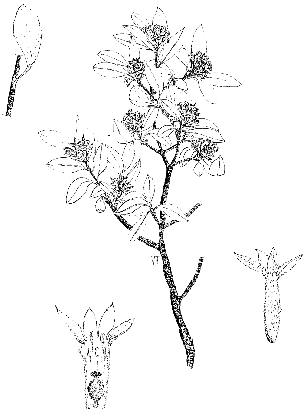
Fig. 3 - Daphne alpina L. subsp. scopoliana Urbani: porzione di pianta \times 0,8 ; particolare della foglia \times 0,8 ; particolare della foglia \times 1,6 ; fiori \times 4 (disegno di F. Valsecchi).