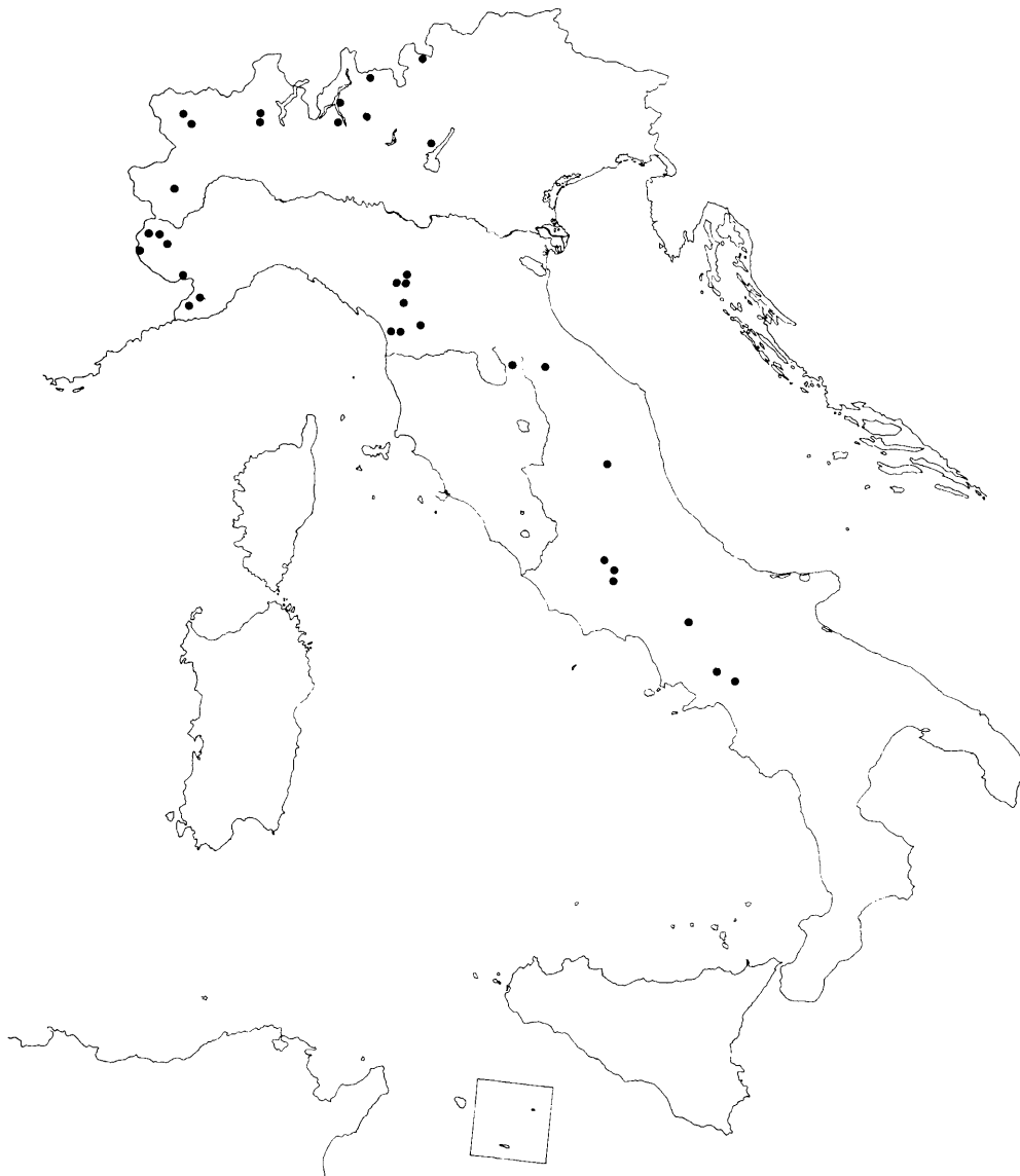
Fig. 2 - Distribuzione di Daphne alpina L. subsp. alpina in Italia. Il sistema di riferimento scelto è il reticolo U.T.M. a maglie di 10 \times 10 Km.