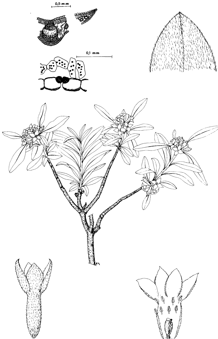
Fig. 1 - Daphne alpina L. subsp. alpina : porzione di pianta \times 0,8 ; particolare della foglia e fiori \times 4 (disegno di A. Mazzanti).