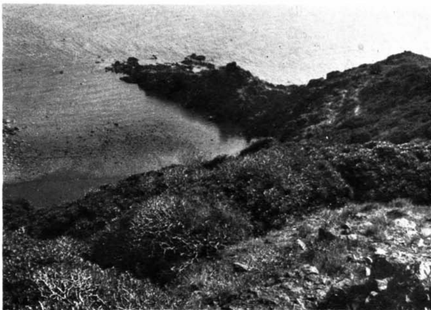
Foghe. La foce del «Rio Mannu»

Di qui l'interesse del lavoro del Farris, che ha almeno il merito di aver rilevato una serie di reperti di cui altrimenti non avremmo notizia, soprattutto perché il libro di scavo, compilato da Ovidio Addis, resta inedito.