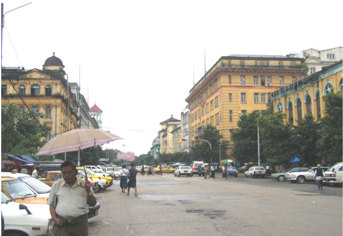
L'Avenue del Gen. Aung San, la via principale della città vecchia di Yangoon.