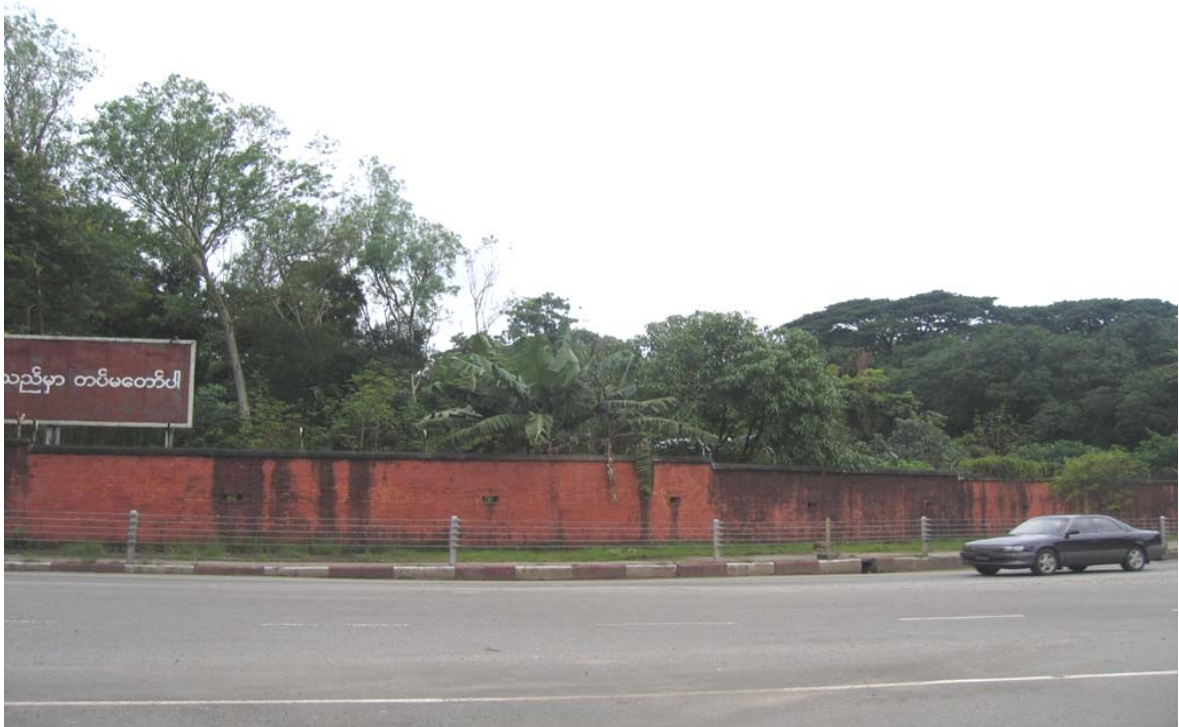
Comando generale del Tatmadaw per la Difesa della Città di Yangoon