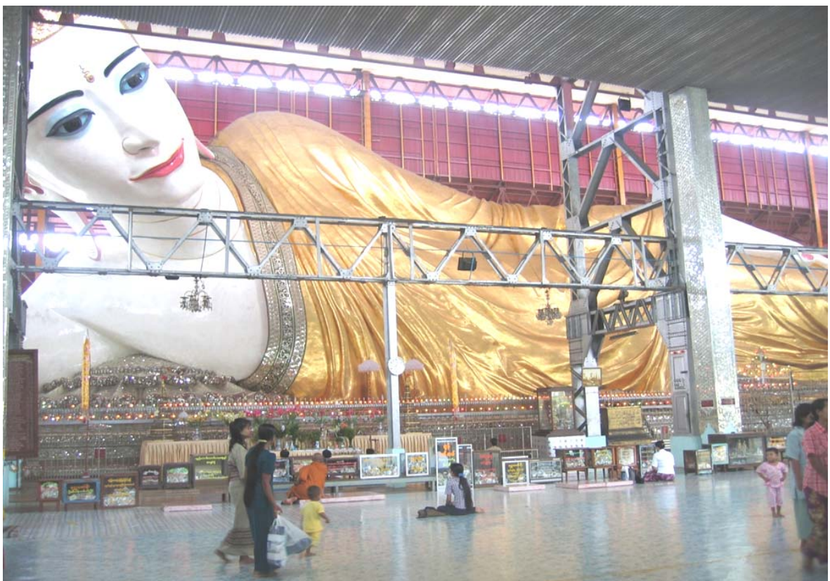
Tempio del Chyopaigy di Yangoon