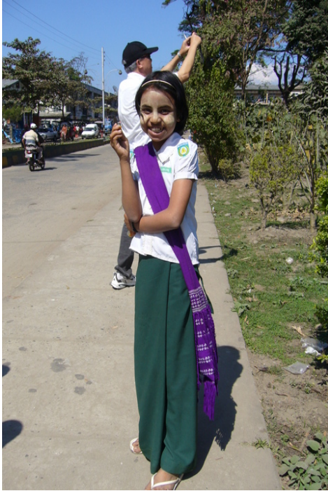
Una ragazza di Myitkyina