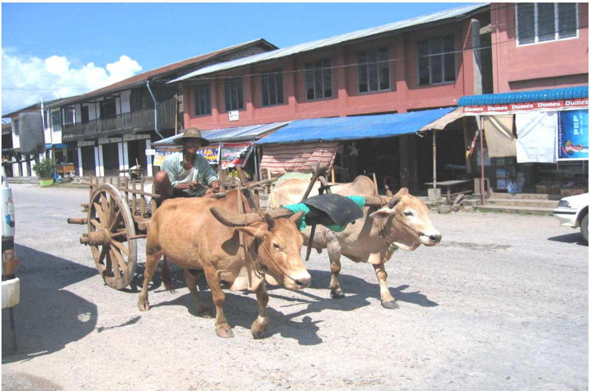
Città di Lashio (Stato Shan nord)