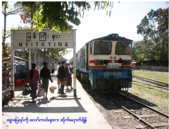
Stazione di Myitkyina (Stato Kachin)