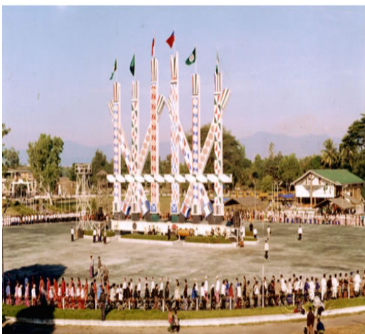
Parco Manaw a Myitkyina