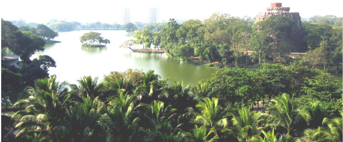
Lago Kandawgyi di Yangoon