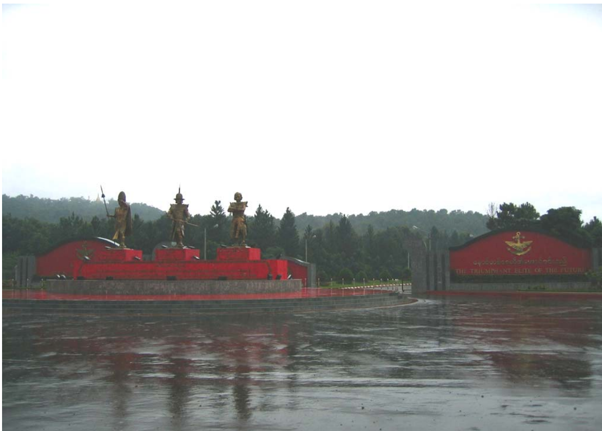
L'Entrata dell'Academia militare del Tatmadaw a Mandalay