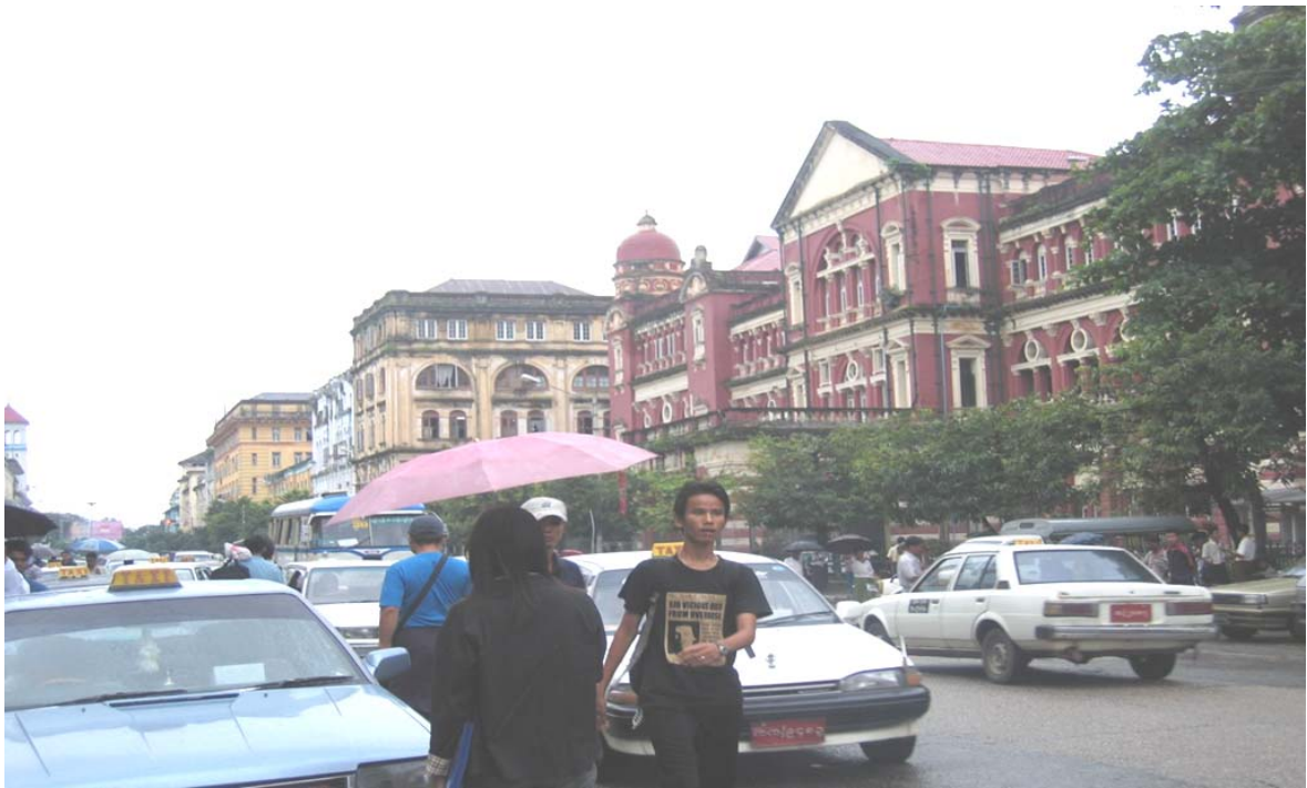
City Hall di Yangoon