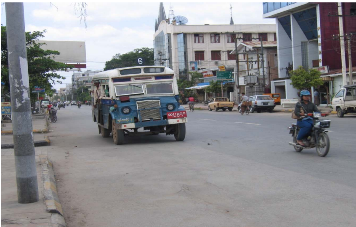
L'Avenue dell'Indipendenza della Città di Mandalay