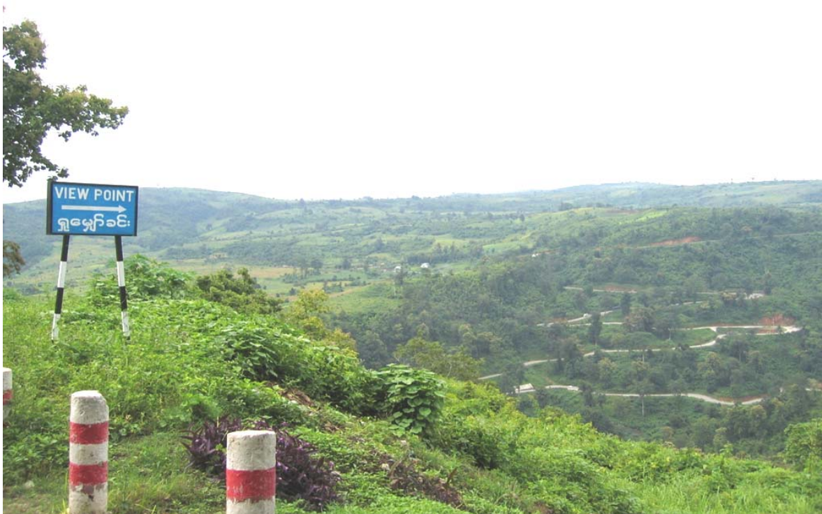
Strada Sino-Indiana (Strada Lido), parte dello Stato Shan nord