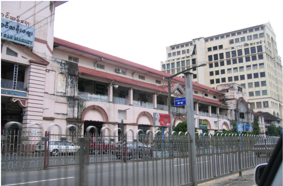
Mercato Aung San di Yangoon