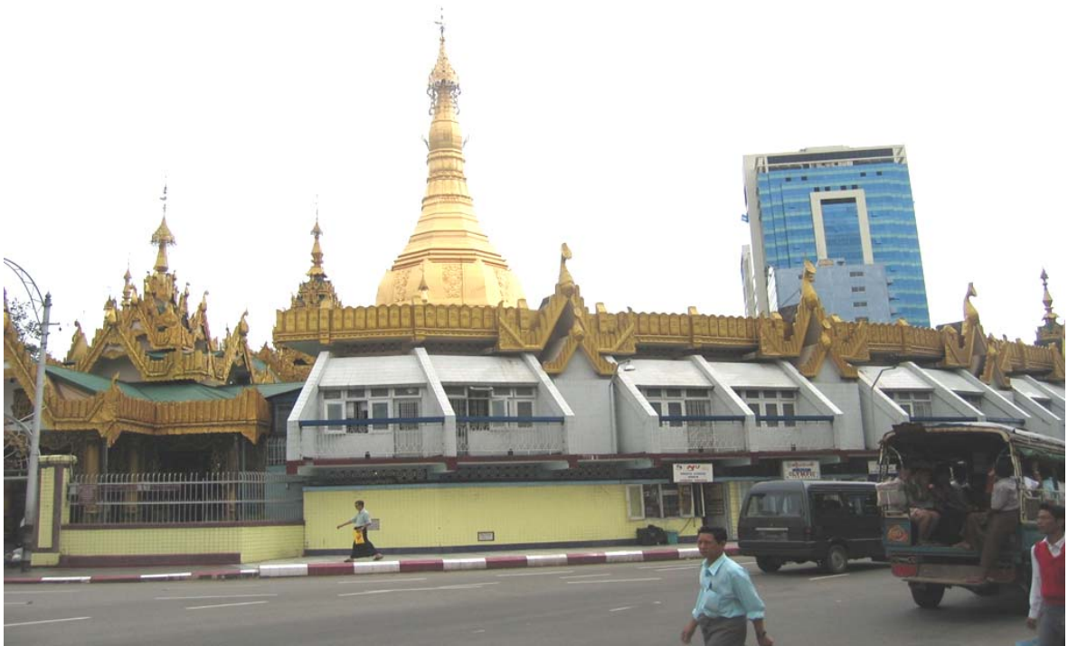
Piazza della Pagoda di Yangoon