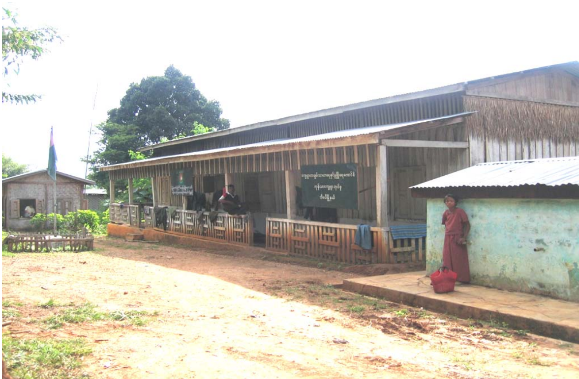
Caserma militare del Tatmadaw nello Stato Shan Sud