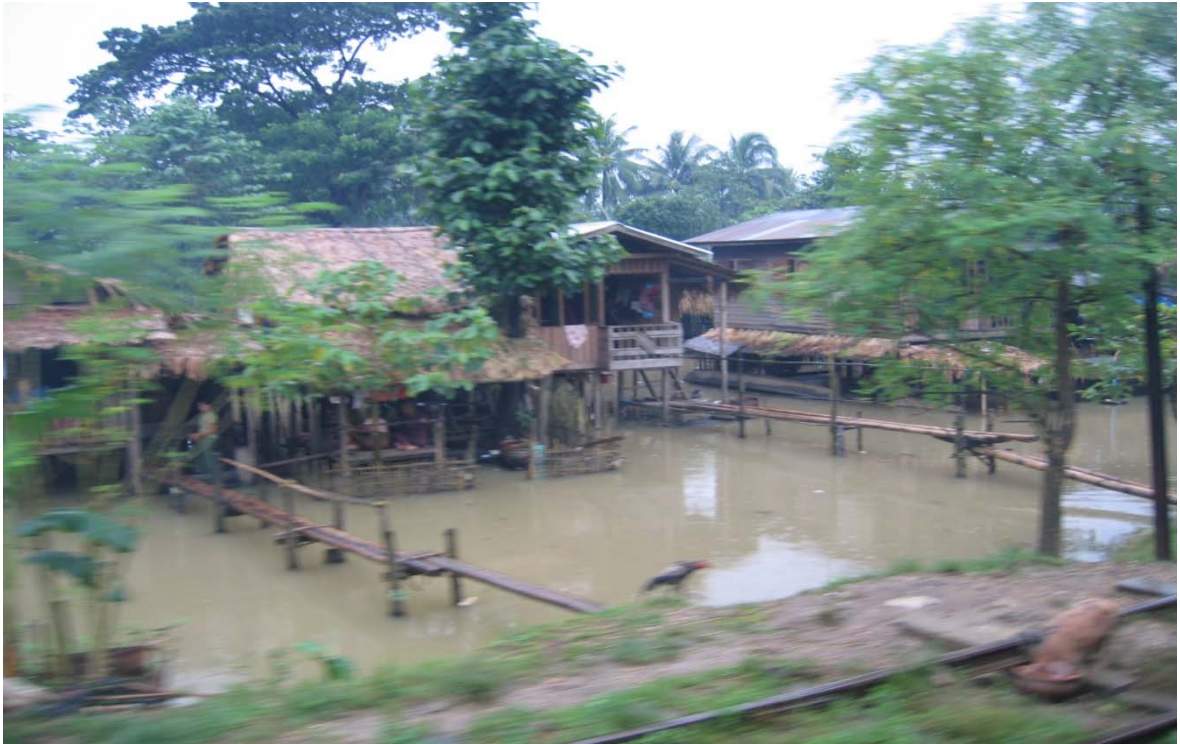
La stagione di pioggia nel Delta d'Irrawaddy