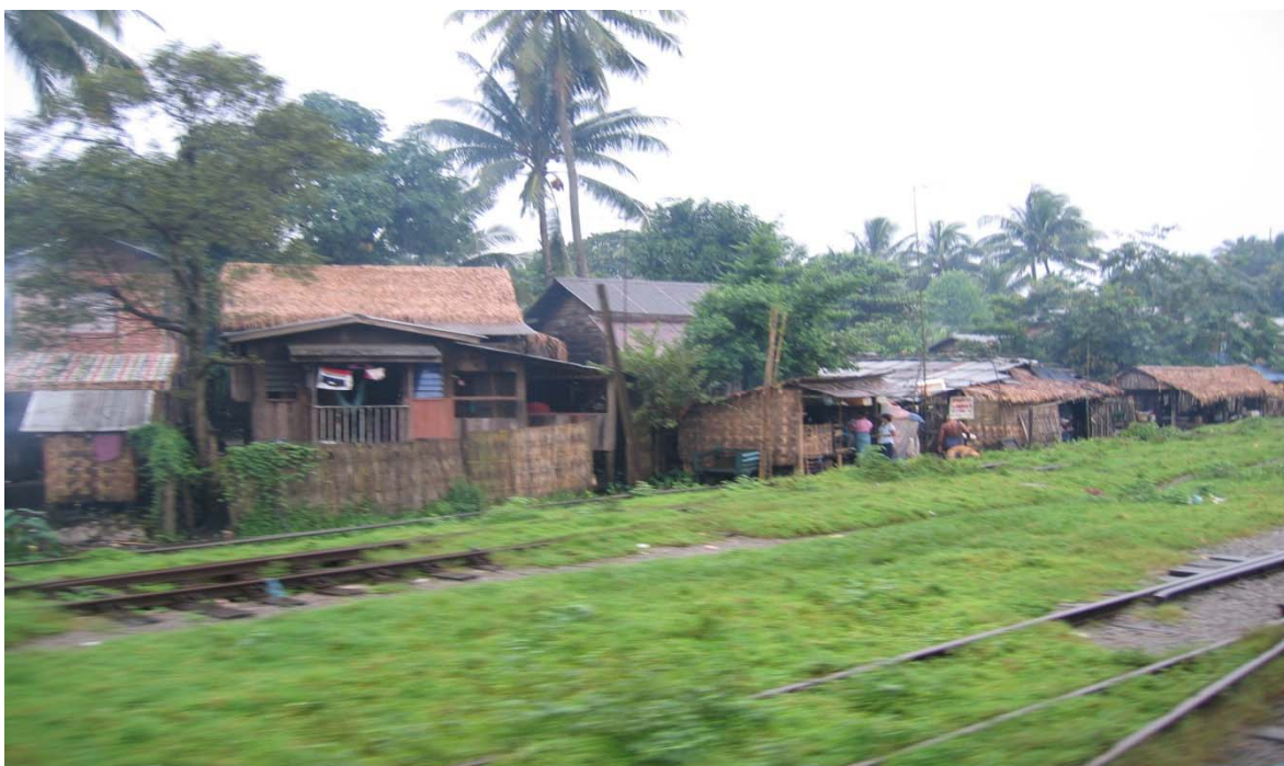
Divisione di Pegu nella Stagione di Pioggia