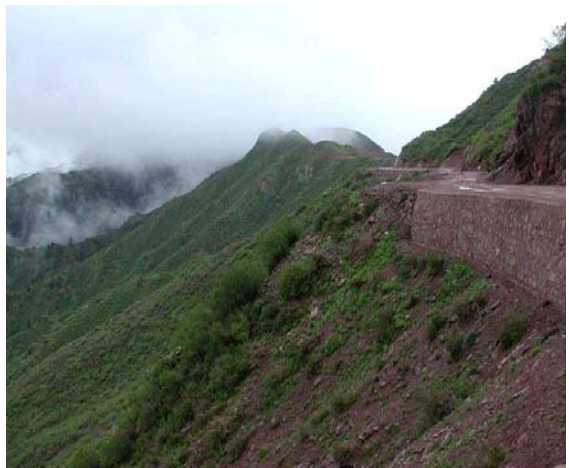
Strada verso l'India (Stato Kachin nord)