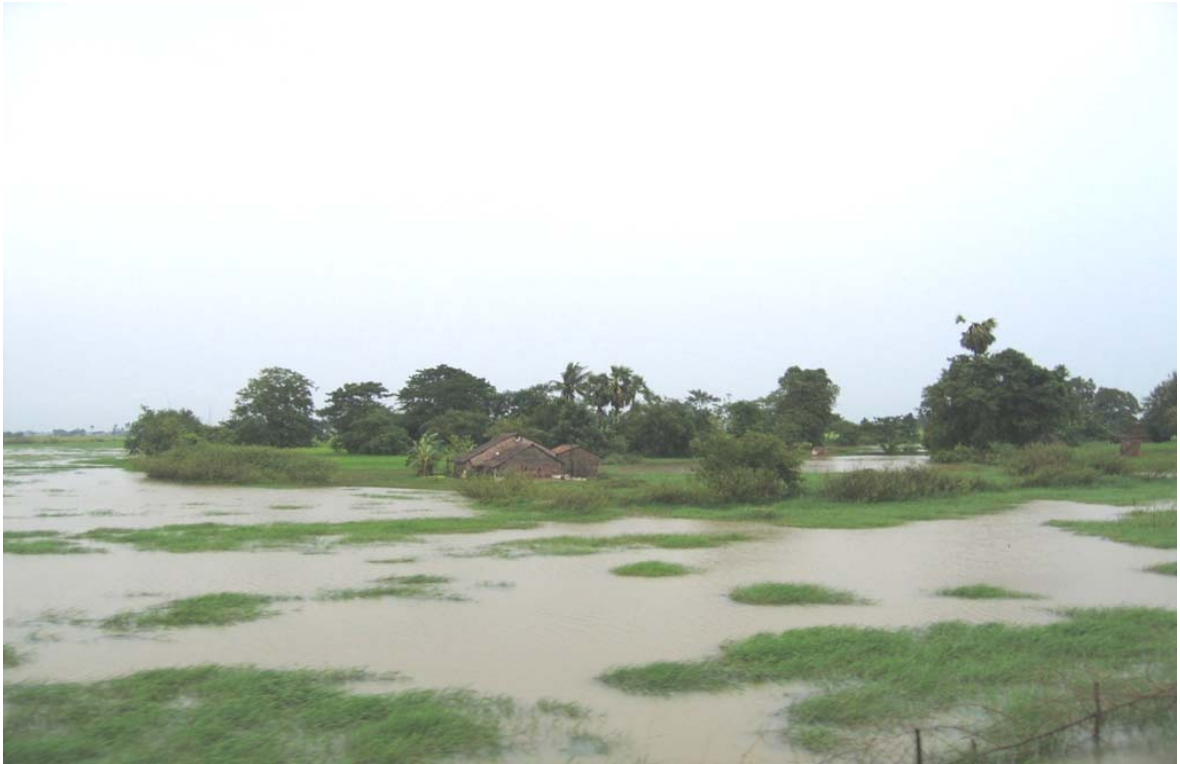
Divisione di Pegu nella Stagione di Pioggia