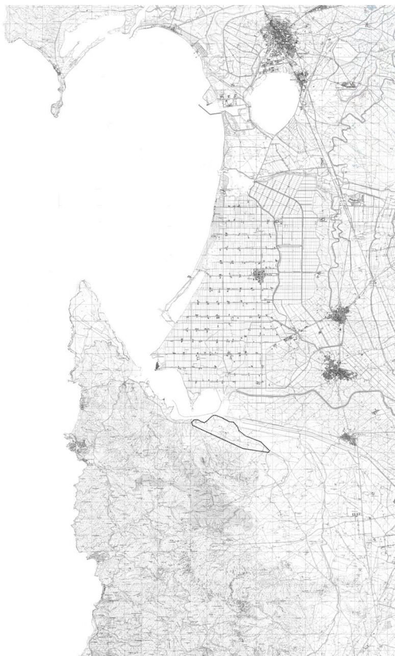
In alto – La localizzazione dell'area archeologica di Neapolis.