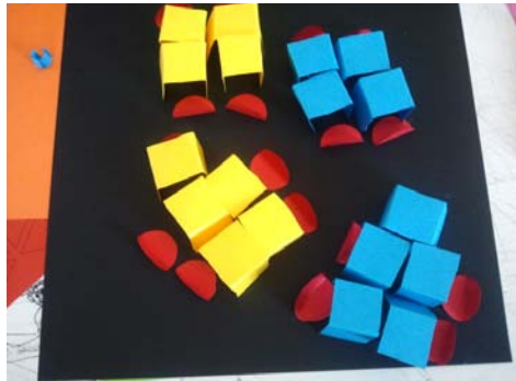
Immagine 2: Progetto di un gruppo che evidenzia la necessità di avere banchi mobili

Se i banchi sono in un modo o in un altro cambia tutto, per esempio se li metti di fronte alla cattedra staccati non puoi discutere con i compagni, io li metterei a gruppi di quattro o cinque così si possono fare dei lavori di gruppo, per esempio una ricerca. Io vorrei dei banchi con delle ruote che sposti quando serve per fare meglio il lavoro, per esempio li puoi mettere in cerchio oppure a gruppi o anche tutti di fronte alla LIM, dipende da quello che stai facendo.