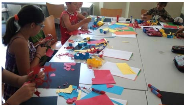
Immagine 1: i bambini durante il laboratorio

Nel mese di luglio 2015 è stato organizzato presso l'Università di Sassari 4 , nei locali del dipartimento di Architettura, Design e Urbanistica di Alghero, un laboratorio didattico nel quale è stato chiesto ai bambini di terza, quarta e quinta di scuola primaria, di descrivere, prima a parole, la scuola che frequentano evidenziando punti di forza e criticità e, successivamente, di progettare in gruppo l'aula che loro piacerebbe avere nelle loro scuole. Le attività del laboratorio sono iniziate con un brainstorming iniziale nel quale è stato chiesto ai bambini di descrivere le aule della loro scuola e di soffermarsi ad individuare aspetti critici da migliorare. Successivamente, è stato chiesto ai bambini di realizzare degli elaborati in cartoncino che rappresentassero l'aula ideale, o meglio quella che a loro parere rende l'apprendimento più piacevole ed efficace (Immagine 1).