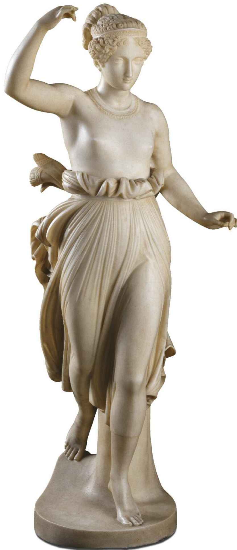
Statua marmorea di Ebe, dello scultore sassarese Andrea Galassi del 1836 circa (Rettorato dell'Università di Sassari)

Fra i contrasti destinati a non essere risolti nel breve periodo vi era, infatti, la richiesta di dispensa dalla frequenza dell'università da parte di molti sacerdoti che, impegnati nel loro esercizio pastorale in paesi dai quali era difficile raggiungere Sassari, incontravano difficoltà a seguire le lezioni, come viceversa era obbligatorio. 40 Di fronte alle ripetute risposte negative delle autorità accademiche, molte saranno però le strade seguite dai sacerdoti per raggiungere, comunque, i propri scopi.