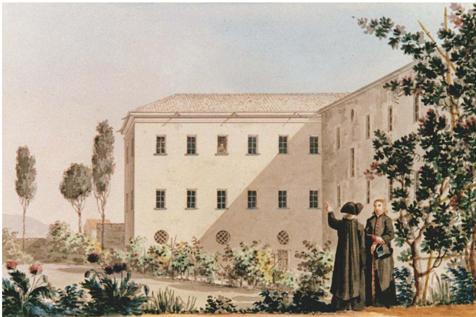
Acquarello di Giuseppe Cominotti raffigurante il “Nuovo braccio” del Seminario tridentino, adiacente al Palazzo dell’Università (Cagliari, collezione privata)

Di qui, il tentativo del censore di difendere il suo operato; precisava infatti: «I professori di tale facoltà – il riferimento era a quella legale – non possono segnare gli admittatur a quei giovani che si meritano l’annotazione di mediocri»; 91 e di seguito: «A vece quindi di lasciare al solo censore tutta l’odiosità del rifiuto, dovrebbero i professori, stando alla legge, negare ... la loro sottoscrizione». 92 Il discorso, peraltro, in quella logica, voleva avere una valenza ben più generale; lo riconosceva esplicitamente lo stesso censore: «Ciò che si dice per la Facoltà legale sarebbe forse il caso di doversi anche estendere a tutte le altre se gli studi vogliono realizzarsi».