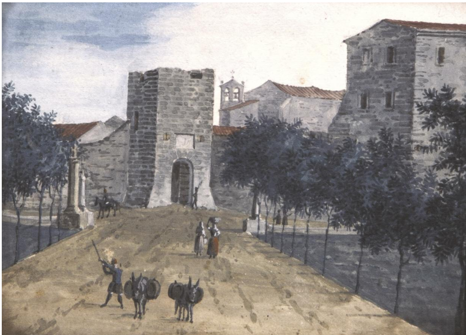
Acquarello di Giuseppe Cominotti raffigurante la Porta nuova della cinta muraria sassarese : a destra si scorge l'edificio dell'università, al centro, dopo la porta, la chiesa, ora demolita, adiacente all'Episcopio (Cagliari, collezione privata)

leggi universitarie», dopo aver, in una logica più generale, dichiarata la sua soddisfazione per la «condotta sì dentro e fuori l'Università», seppur con qualche «piccolo fallo» 83 – poco più di 300 erano gli studenti, complessivamente –, proseguiva la sua analisi, dalla quale emergevano molti problemi – e non di secondaria importanza – nel collegio teologico, 84 ma anche in quello legale e in quello di medicina, dove non era raro trovare docenti che non avevano ancora «compilato il rispettivo trattato» da inviare al sovrano per la sua approvazione, nonostante «il loro dovere cotanto importante per l'istruzione e necessario in seguito all'abolizione della dittatura».