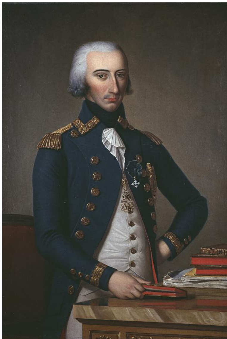
Ritratto di Placido Benedetto conte di Moriana, governatore del Capo di Sassari e del Logudoro del 1800-02 (Biblioteca Universitaria di Sassari)