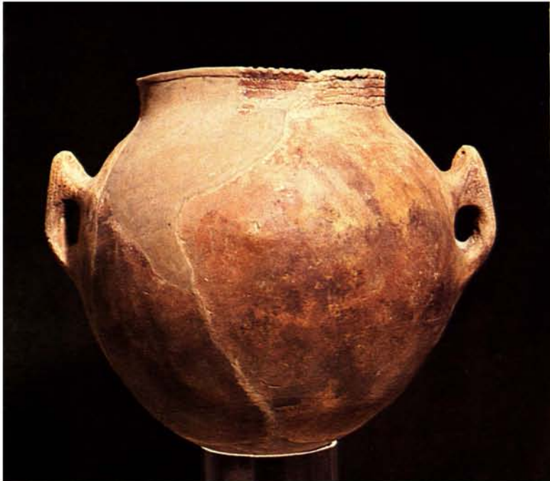
46. Vaso della Grotta Verde, da Capocaccia. Il grande spuntone calcareo di Capocaccia, che domina la baia di Alghero, ha ospitato, in una delle sue tante grotte, episodi di vita della più lontana preistoria isolana.