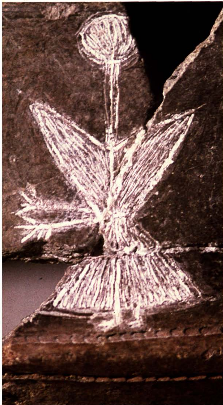
47. Figurina femminile incisa su un vaso della cultura di San Michele. Conservata nel Museo Nazionale "G.A. Sanna" di Sassari, viene dalla Grotta di Sa Ucca de su Tintirriolu (3750 avanti Cristo circa), vicino a Mara.