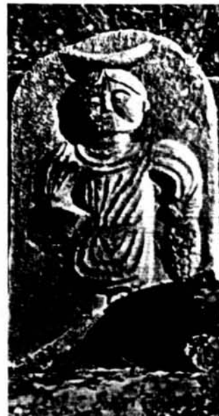
Foto 3 Aïn Nachma, Stele votiva a Saturnus.