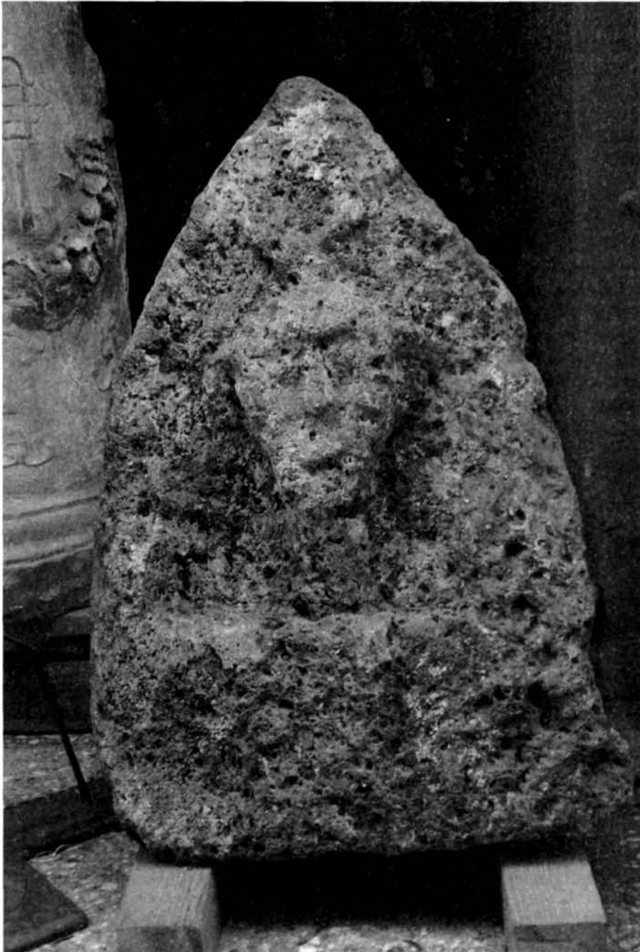
Foto 4 - Santu Lussurgiu, Loc. Procalzos, Cippo votivo a Saturnus (?)