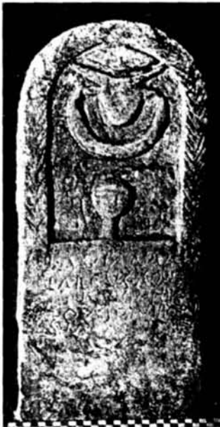
Foto 2 Cartagine, Stele votiva a Saturnus.