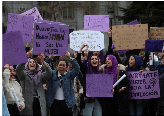
Fig. 7: La couleur violette dans des pancartes féministes (BuzzFeed 9.03.2019).