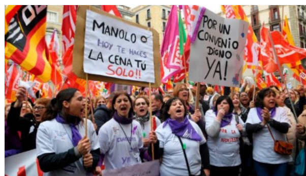
Fig. 4: Manolo dans une pancarte féministe espagnole (Tiempo de actuar 13.03.2019).

Dans les pancartes en espagnol, il n'y a pas de destinataires si spécifiques, à l'exception de quelques allusions à l'extrême droite, mais on y retrouve plutôt des personnages emblématiques fictifs, comme Hermione Granger de la série de Harry Potter ("Sin Hermione, Harry Potter hubiera muerto en el primer libro") ou un certain Manolo, un individu masculin générique protagoniste d'un langage idiomatique, cité dans l'énoncé en rime "Manolo, hazte la cena tu solo" (fig. 4).