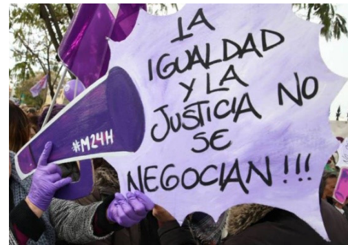
Fig. 8/9: Des emblèmes des pancartes féministes (France inter 23.11.2019; El País 15.01.2019).