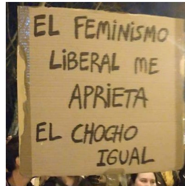
Fig. 5/6: L'humour des pancartes féministes (Les Inrockuptibles 23.11.2019; Público 9.03.2019).