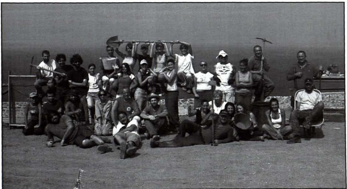
Fig. 3 - Il gruppo di scavo.

Nonostante alcuni documenti scritti parlino infatti di rifacimenti apportati, almeno dal Cinquecento, alle difese medievali di Castelsardo (in particolare al lato terra, che era considerato il più vulnerabile), l'archeologia, che da tempo si è spinta oltre il mondo antico, ha distintamente mostrato, in questa occasione, la sua incisiva capacità di fare storia anche per le epoche maggiormente vicine a noi, traducendo l'indistinto del sepolto in un linguaggio comprensibile, in grado di proiettare l'analisi puntuale propria dell'archeologia verso l'interpretazione di processi storici significativi e di lunga durata cronologica. ■