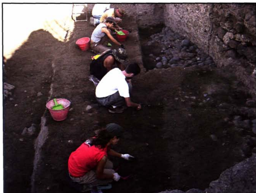
Fig. 1 - Una fase di scavo al ridosso del bastione.

L'interesse di questo ritrovamento è infatti quello di averci restituito una visione storicamente più articolata e credibile di una porzione delle mura del borgo castellano, con una fase più antica, almeno trecentesca, riferibile al periodo in cui il castello era un cardine della signoria dei Doria nella Sardegna nord-occidentale, che nel XIV secolo (in particolare dopo l'occupazione catalana di Alghero del 1354) divenne il punto di riferimento per la resistenza anti-aragonese nell'Isola.