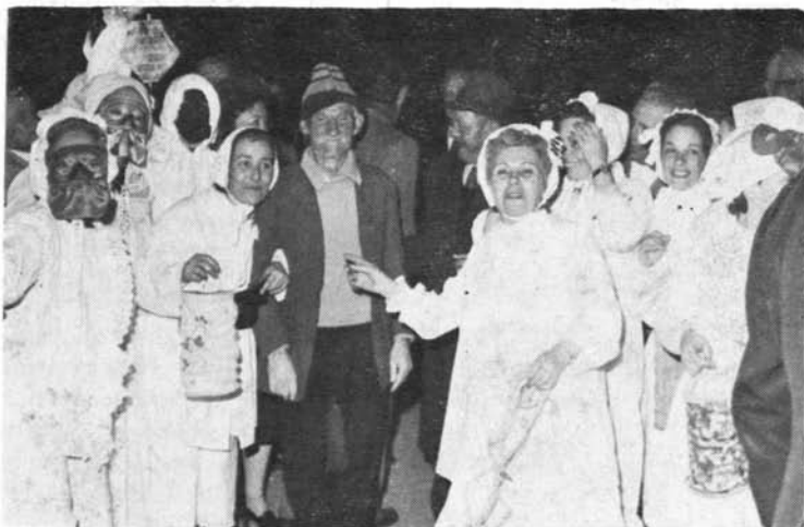
Una scena del Carnevale bosano del 1975