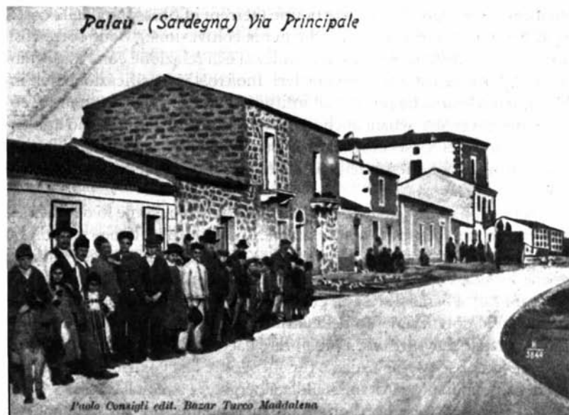
FIGURA 6 Palau. Una immagine dei primi anni del XX secolo