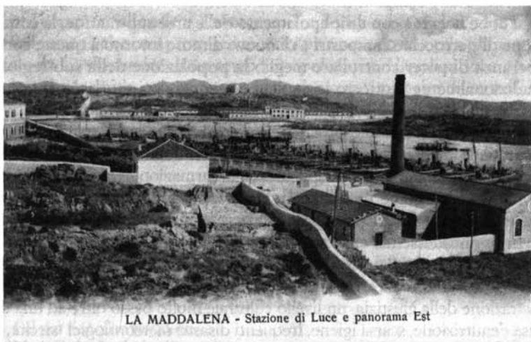
LA MADDALENA - Stazione di Luce e panorama Est

La stazione di Luce e il panorama est del porto di La Maddalena in una veduta dei primi anni del XX secolo