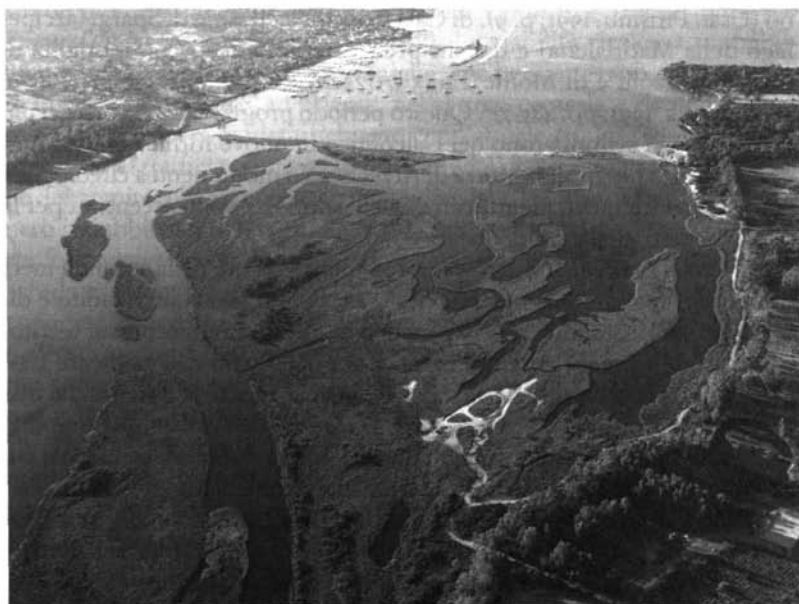
FIGURA 4 Foce del Riu S. Giovanni, Golfo di Arzachena

La fascia costiera ha i tipici caratteri morfologici ed evolutivi della costa a rias (Demuro, Ulzega, 1985; Pranzini, 2004): presenta un caratteristico andamento frastagliato, in un'alternanza di piccole baie e profonde insenature, separate da ampi tratti rocciosi, derivanti dalla recente sommersione di valli fluviali, le più incise delle quali hanno dato origine a profondi golfi come quello di Arzachena (FIG. 4) e insenature come quelle di Porto Pozzo (Santa Teresa di Gallura), di Porto Pollo (Palau), di Cugna, di Poltu Quatu (= porto nascosto) presso Baia Sardinia, di Porto Cervo, così denominato per le numerose ramificazioni dell'insenatura. Indubbiamente in ogni tratto costiero dell'ambito vi sono angoli incantevo-