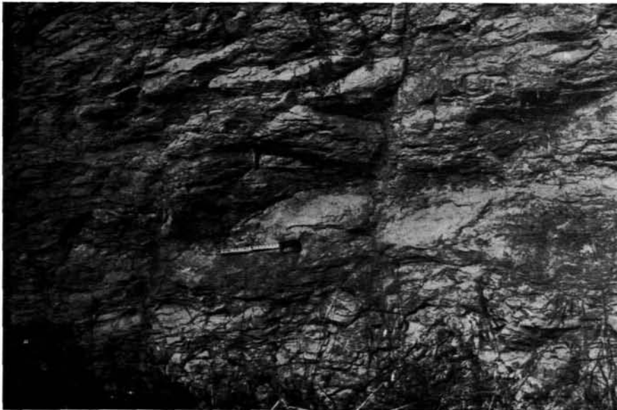
Fig. 2 - Arenarie a grana fine debolmente cementate osservabili lungo la mulattiera che porta a M. Pèlao.