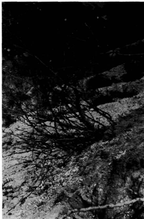
Fig. 4 - Un albero di ciliegio è stato quasi completamente ricoperto dai materiali dell'ultima frana.

A valle dell'intersezione tra la mulattiera e l'impluvio, lungo il quale si muove la frana, è stato possibile rilevare la presenza di un ricoprimento, sulle arenarie a grana fine, di materiali argillosi che si estendono fino all'abitato in prossimità del caseggiato scolastico.