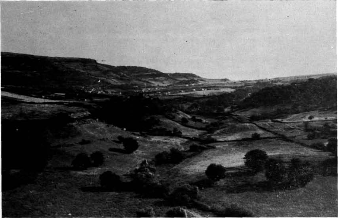
Fig. 1 - Versante occidentale di M. Pèlao: a metà costa l'abitato di Bessude, in alto i dirupi basaltici dell'altopiano.