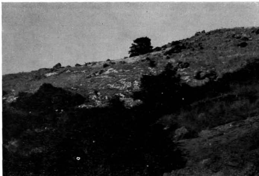
Fig. 3 - In primo piano sulla destra in basso è osservabile una parte del fronte di frana che ha ostruito la mulattiera per M. Pèlao; più in alto si nota il gradone calcareo di quota 550 ed infine sullo sfondo in alto i numerosi massi ematici che per rotolamento scendono verso l'abitato.

I tipi litologici sono assai diversi per genesi e chimismo, tuttavia gli affioramenti a valle di Bessude, riportati a giorno dall'intensa azione erosiva delle acque, sono essenzialmente tufacei. La natura è trachi-liparitica.