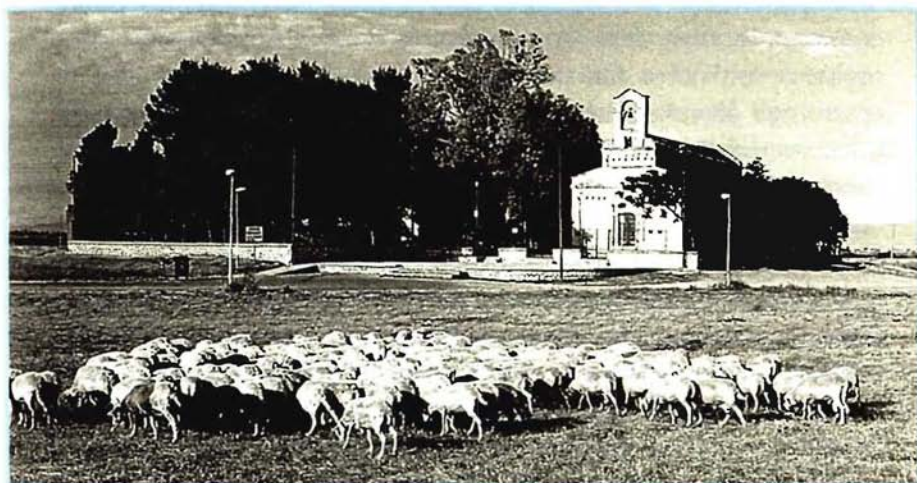
Fig. 17 Chiesa romanica pisana di Santa Maria di Uta.

Immersa nel caratteristico paesaggio della bidatzione , questa è probabilmente l'ultima chiesa costruita in Sardegna (1350 circa) dai Vittorini, protagonisti di una intensa stagione di cultura e di evangelizzazione.