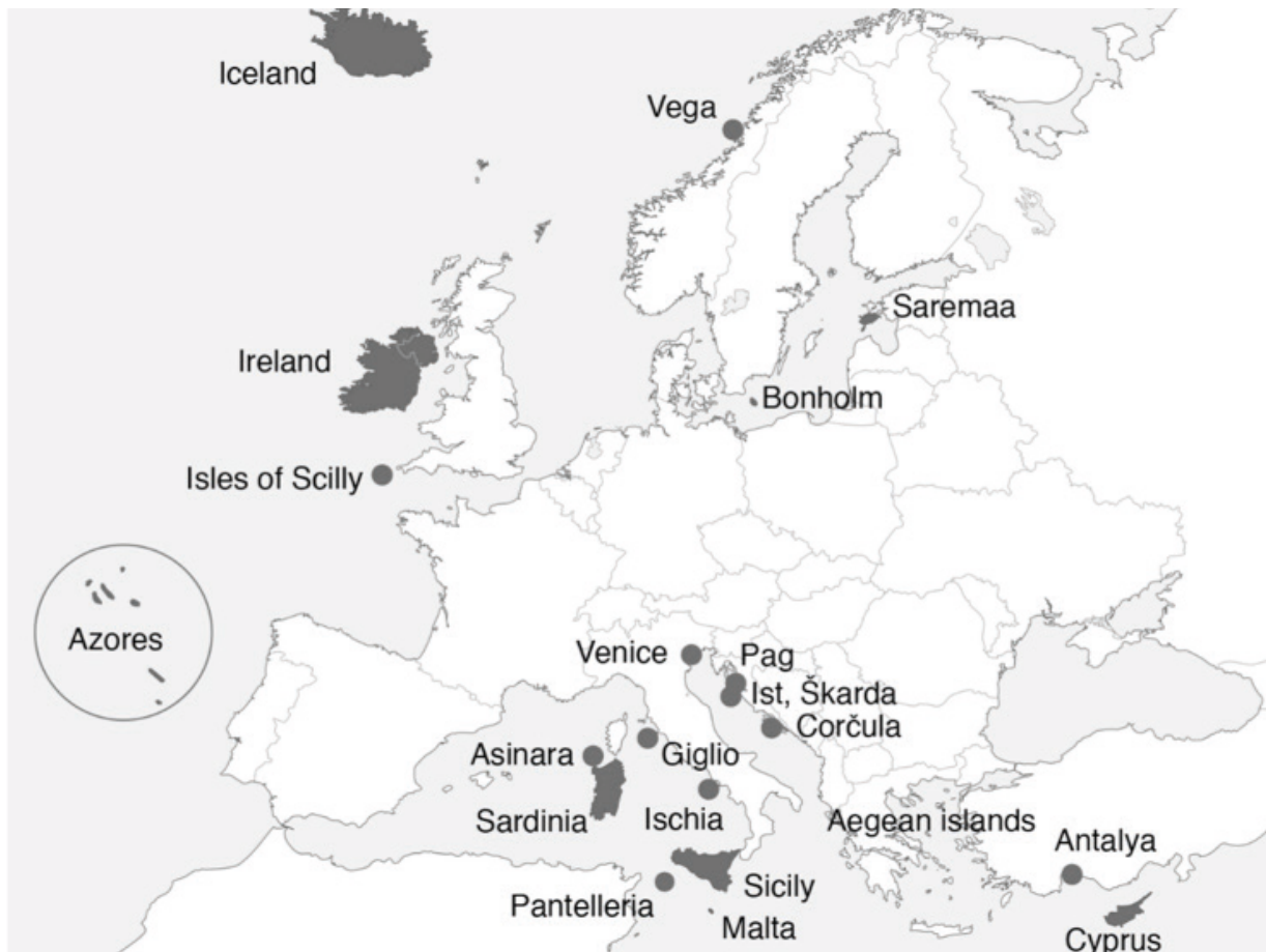
Fig. 1. Le isole studiate dal Network ESLAND