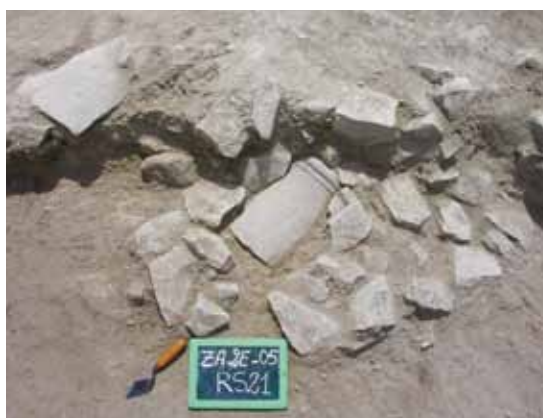
Zama Regia Settore II: immagini di contesti in corso di scavo; in alto a destra ghianda missile in argilla, in basso a sinistra coppa in vernice nera di imitazione locale (elaborazione di Michele Guirguis).

ma, durante e dopo la battaglia che decise le sorti delle due potenze mediterranee. Nel periodo in esame, come rimarcato di recente da Mansour Ghaki la città controllava un proprio territorio di pertinenza e rientrava nell'amministrazione giuridica del distretto della Thusca (App. Lib. 68), a sua volta derivato da un'organizzazione territoriale cartaginese del V-IV secolo a.C. (Ghaki 2012; Manfredi 2003). A tal riguardo segnaliamo il valore documentario di un'iscrizione in neopunico proveniente da Mactaris della metà del II secolo a.C. il cui contenuto è stato di recente pubblicato da François Bron seguendo una rilettura di Mhamed Hassine Fantar e di Maurice Sznycer (Bron 2014). Correggendo la precedente edizione di K. Jongeling, oggi sappiamo che il documento riferisce di un personaggio che si definisce b'l Zm'n 'cittadino di Zama'. Si tratta della prima e significativa menzione in lingua punica del poleonimo Zama/ Zm'n . La menzione di un personaggio che si dichiara 'cittadino', sembra confermare