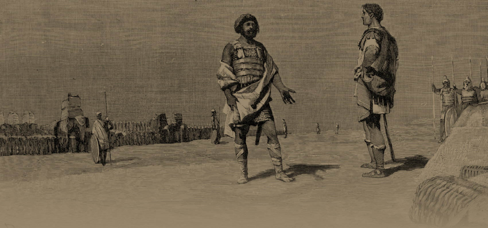
Annibale e Scipione alla vigilia della battaglia di Zama, da F. Bertolini, Storia di Roma , illustrata da L. Pogliaghi, Milano 1899.