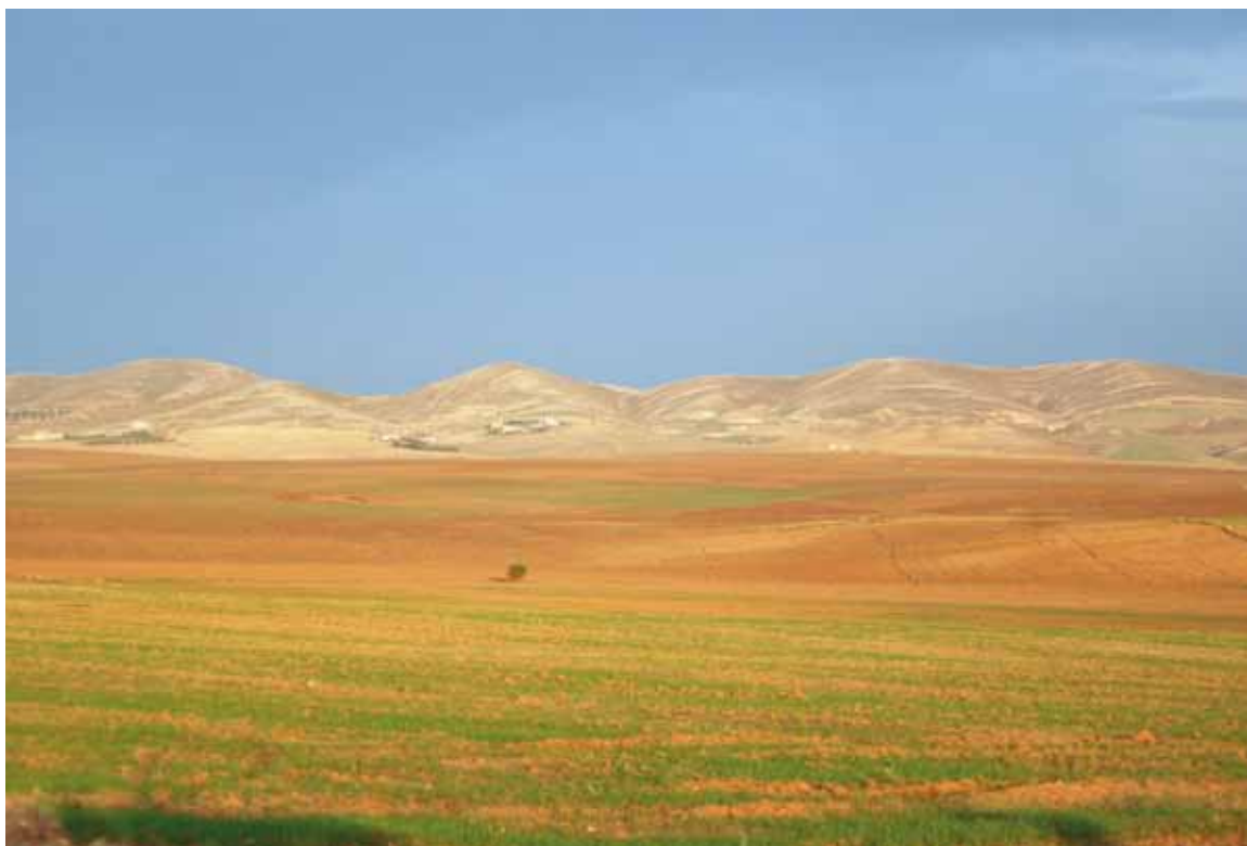
Veduta verso occidente della piana di Zama dalla periferia di Siliana (Foto di Michele Guirguis).

plexità sul supposto rapporto del monumento con Zama, che «lorsqu'on arrive de l'est, c'est-à-dire de Siliana ou de Jama, l'édifice, longtemps masqué par la topographie, n'apparaît enfin que lorsqu'on se trouve tout proche de lui» (Ferchiou 1991, 45). Tuttavia ci domandiamo se lo scontro decisivo della cavalleria, dopo il lungo inseguimento, possa essere avvenuto nella fascia collinare dominata dal Kbor Klib e se quindi la localizzazione del monumento, oltre a costituire una scelta di tipo "ambientale", non possa essere stata dettata dalla precisa volontà di mante-