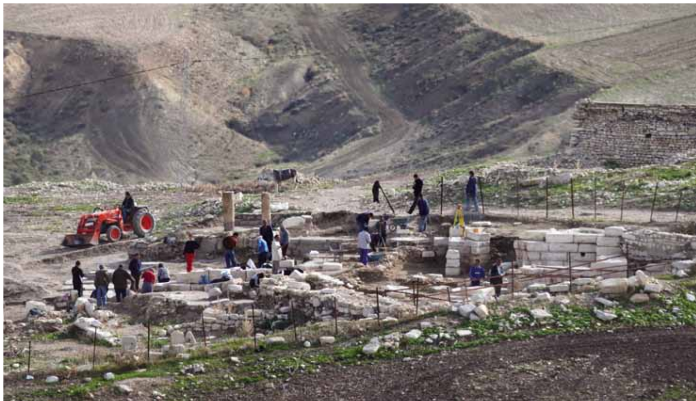
Il settore termale di Zama Regia visto dalla collina dell'acquedotto.

(Szyner 1997), l'epigrafe monumentale sarebbe stata posta, nel ventunesimo anno di 'Micipsa il sovrano' ( Mkwsn hmmlkt ), da un personaggio con nome numidico ( Wlbn ) 'preposto ai territori della Tushkat' ( š 'l 'rst Tšk't ); nella linea genealogica del dedicante sono indicati il padre (con nome punico), il nonno, il bisnonno e il trisnonno, quest'ultimo corrispondente al re Zilalsan/Zililsan ( Zllsn : nonno di Massinissa). Il dedicante, qualificabile come un 'prefetto distrettuale', sarebbe dunque un cugino dello stesso Micipsa e da questi posto attorno al 128/126 a.C. a sovrintendere l'organizzazione distrettuale della TŠK'T.