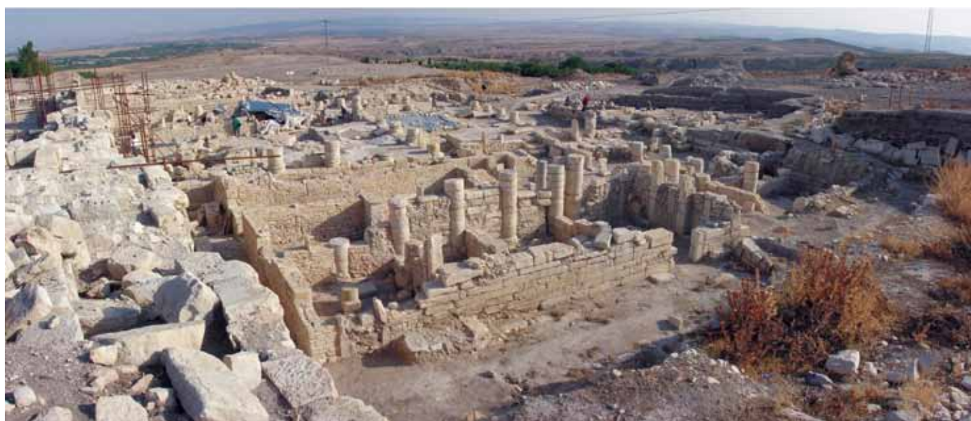
Immagini del sito di Zama Regia: in basso veduta del Settore I; in alto Settore II (elaborazione di Michele Guirguis).

Simitthus) che raramente si collocano in una fase precedente alla metà del II secolo a.C. (Ferchiou 2011), confermando in tal modo lo sviluppo del centro, anche in forme monumentali, ancor prima del regno di Giuba.