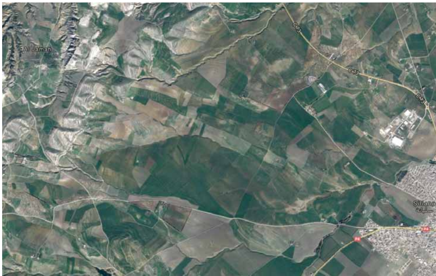
La piana localizzata tra Siliana (a est) e Jama/Zama Regia (a ovest).

sione daimonios ) nel campo di battaglia con l'esercito di Scipione solo in una fase avanzata, in modo da poter attaccare alle spalle l'ultima fila dell'esercito cartaginese (costituita dalla più tenace fanteria composta dai veterani italici), contribuendo in maniera decisiva alla vittoria finale. La natura accidentata dei rilievi e delle colline che circondano la piana di Siliana, piuttosto che un ipotetico campo di battaglia largamente pianeggiante e con ampie vie di fuga e ricongiungimento, potrebbe spiegare la tempistica ritardata e lo sviluppo, quasi 'parallelo', degli scontri di cavalleria rispetto al cuore della battaglia di fanteria.