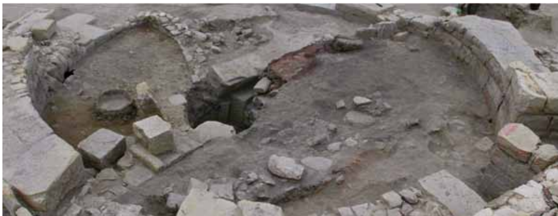
Differenti fasi di scavo nella grande struttura circolare dell'impianto termale (Foto di Michele Guirguis).

anche nell'ottica del vettovagliamento delle proprie truppe. Secondo l'ipotesi che avanziamo in questa sede, Annibale poté collocare il proprio accampamento proprio nei dintorni di Zama, a ridosso del centro abitato, ma certamente non all'interno della città stessa, dal momento che Livio (XXX, 36, 1) non riferisce della expugnatio di una urbs ma di expugnatis hostium castris direptisque .